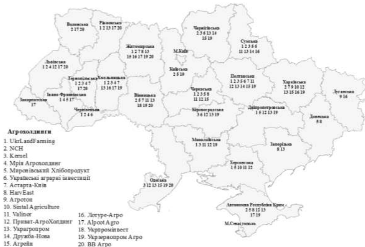
Рис. 2. Регіони, в яких розташовані землі найбільших агрохолдингів* *Джерело: розроблено за даними офіційних сайтів агрохолдингів.

У кожному з цих регіонів агрохолдинги контролюють понад 200 тис. га земельних ресурсів.