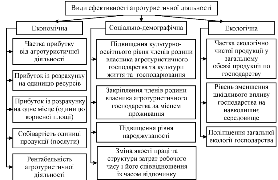
Рис. 3. Показники ефективності агротуристичної діяльності для агротуристичного господарства [9, с. 42]

Група авторів – Г.В. Черевко, І.В. Черевко та Г.І. Шимечко розробили і запропонували систему показників ефективності агротуристичної діяльності агротуристичного господарства (рис. 3).