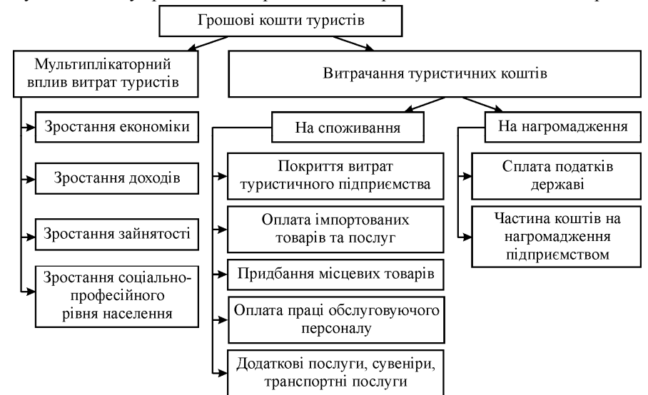
Рис. 1. Мультиплікаційний вплив коштів туристів на соціально-економічний стан туристичної території (розробила Я. Григор'єва)

Позитивний соціально-економічний ефект туризму та канали розподілу туристичних коштів можна проілюструвати на рис. 1. Грошові кошти туристів позитивно впливають на поживлення економіки, зростання доходів території, де розміщене туристичне підприємство, зростання зайнятості населення та його соціально-професійного рівня. Туристичний бізнес стимулює розвиток інших галузей господарства, зокрема таких як: будівництво, зв'язок, харчова промисловість, торгівля, виробництво сувенірів та товарів для господарства. Вплив туризму на економіку країни можна простежити на прикладі готельного господарства.