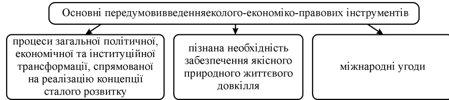
Рис. 4. Основні передумови застосування еколого-економіко-правових інструментів

лісокористування. Отже, в Україні необхідно розробити та активно використовувати інтегровані еколого-економіко-правові інструменти, на основі яких забезпечувалась би реалізація сталого лісокористування.