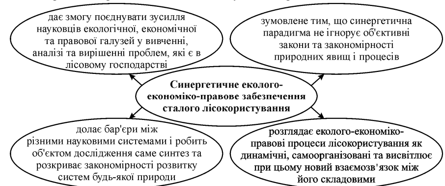
Рис. 1. Синергетичне еколого-економіко-правове забезпечення сталого лісокористування

З огляду на це, настала потреба в розробленні та реалізації такого нового науково-дослідного напрямку як "Синергетичне еколого-економіко-правове забезпечення сталого лісокористування" (рис. 1). Цей напрям дає змогу об'єднати зусилля науковців екологічної, економічної та правової галузей у вивченні, аналізі та вирішенні проблем, які є в лісовому господарстві.