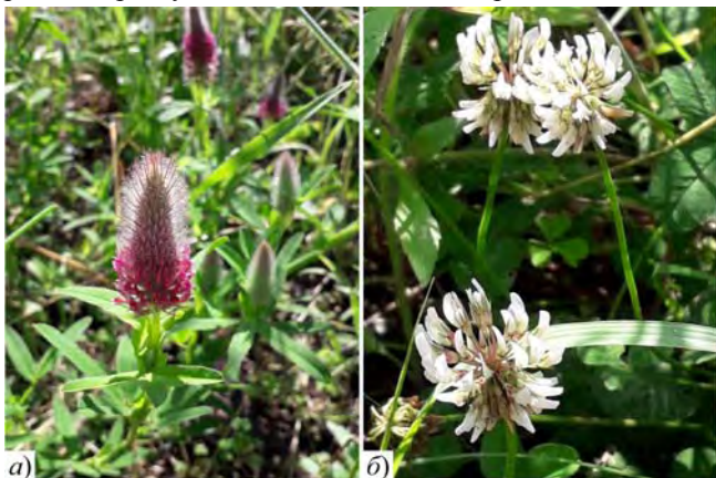
Рис. 1. Рослини: а) T. rubens ; б) T. repens на ділянках відділу природної флори НБС

T. repens (конюшина повзуча) – багаторічна рослина із сланкими пагонами, які укорінюються по вузлах. Листки довгочерешкові, трійчасті; листочки оберненояйцеподібні, дрібнозубчасті. Квітки білі. Є добрим медоносом. Вид поширений у Євразії, Пн. Африці та Пн. Америці; широко культивується. Прекрасна рослина для пасовищ, оскільки добре витримує витоптування. В Україні часто росте на полях, луках, вздовж доріг (окрім високогір'я Карпат) [2, 3]. У ботанічному саду рослини ростуть на газонах, вздовж доріг і стежок.