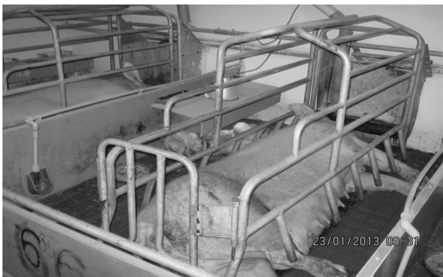
Рисунок 1. Станок для утримання підсисних свиноматок та новонароджених поросят

До спеціальних заходів профілактики травматизму у господарстві належать технологічні оперативні втручання – це ті операції, які передбачені технологічною картою виробництва свинини. Доцільність внесення їх науково обґрунтована і підтверджена на виробництві протягом багатьох років. На сьогодні такими оперативними втручаннями є скушування зубів, каудотомія та кастрація самців. Кожна з них має свої показання, але більшість із них проводяться для зменшення технологічного травматизму.