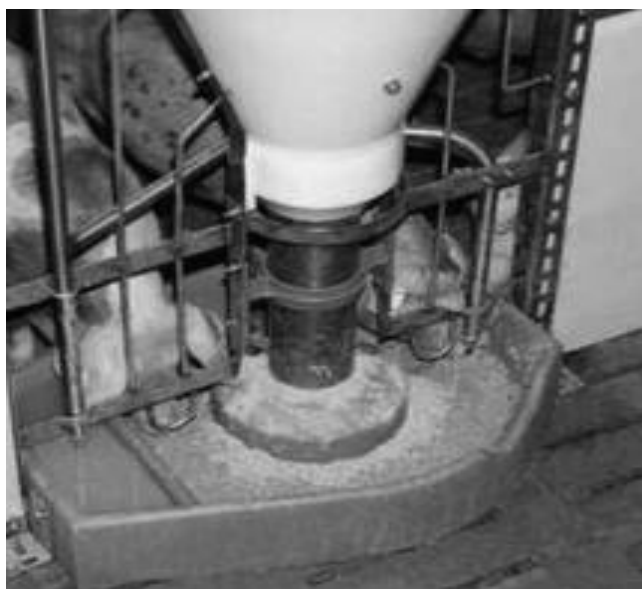
Рисунок 2. Сучасна годівниця для поросят на відгодівлі

Порося народжується із 8-ма молочними зубами – по 2 ікла та 2 окрайка в кожній щелепі. Морфологічно вони є повністю розвиненими: повністю прорізани коронки, мінералізовані емаль і дентин, сформована зубо-ясенна кишеня. Результати вивчення висоти, ширини й товщини коронок вказують, що вони мають досить широкі межі коливання у різних індивідуумів. Молочні зуби, особливо окрайки, своєю формою різко відрізняються від постійних. Форма молочних іклів та окрайків у поросят клиноподібна на розрізі – поперечноовальна. Верхні частини (оклюзійні поверхні) молочних іклів верхньої і нижньої щелеп та окрайки нижньої мають форму конуса. Коронка окрайка верхньої щелепи мечоподібно зігнута, верхівка притуплена [4, 5].