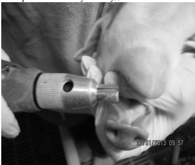
Рисунок 4. Видалення зубів у поросят за допомогою приладу для сточування

Нині достеменною причиною розвитку канібалізму у поросят не встановлено. Одні автори вказують на незбалансованість раціонів, годівлю малооб'ємними кормами, перегрупування тварин, розвиток стресу, відсутність моціону та вигульового утримання тощо [8, 9]. Проте можна навести цілий ряд господарств, де ці причини відсутні, а канібалізм реєструється. Тому для профілактики цього захворювання виконують каудотомію.