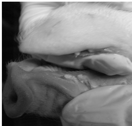
Рисунок 5. Вигляд коронок зубів у поросят за використання приладу для сточування

Каудотомія – це видалення хвоста. За цієї операції можна виконувати як ампутацію, так і ексартикуляцію хвоста. У практиці частіше застосовують ампутацію, оскільки вона простіше виконується [10,11].