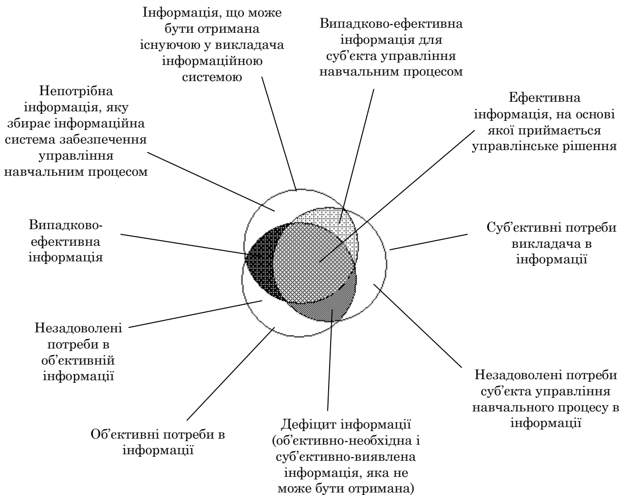
Рис. 2. Взаємозв'язки, що існують між потребами в об'єктивній і суб'єктивній інформації

I_{exid.i} ( i = 1, 2, 3 \dots n ) – інформація, що надійшла.