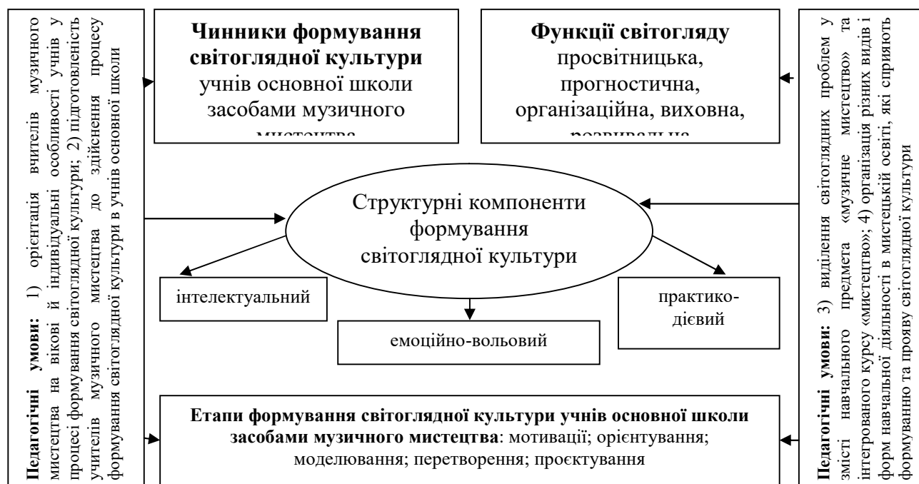
Рис. 2. Схематичне зображення процесуального аспекту формування світоглядної культури учнів основної школи засобами музичного мистецтва

визначено чинники формування світоглядної культури, виокремлено структурні компоненти, розроблено та обґрунтовано педагогічні умови й визначено етапи формування світоглядної культури учнів основної школи засобами музичного мистецтва.