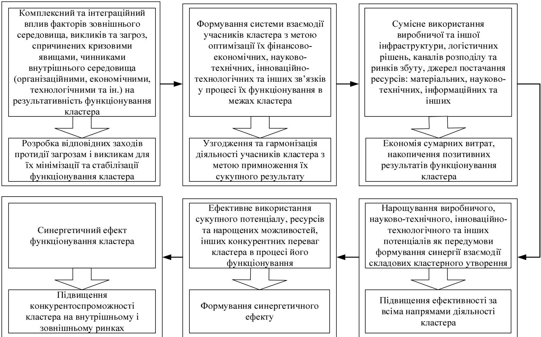
Рис. 2. Схема формування синергетичного ефекту кластера