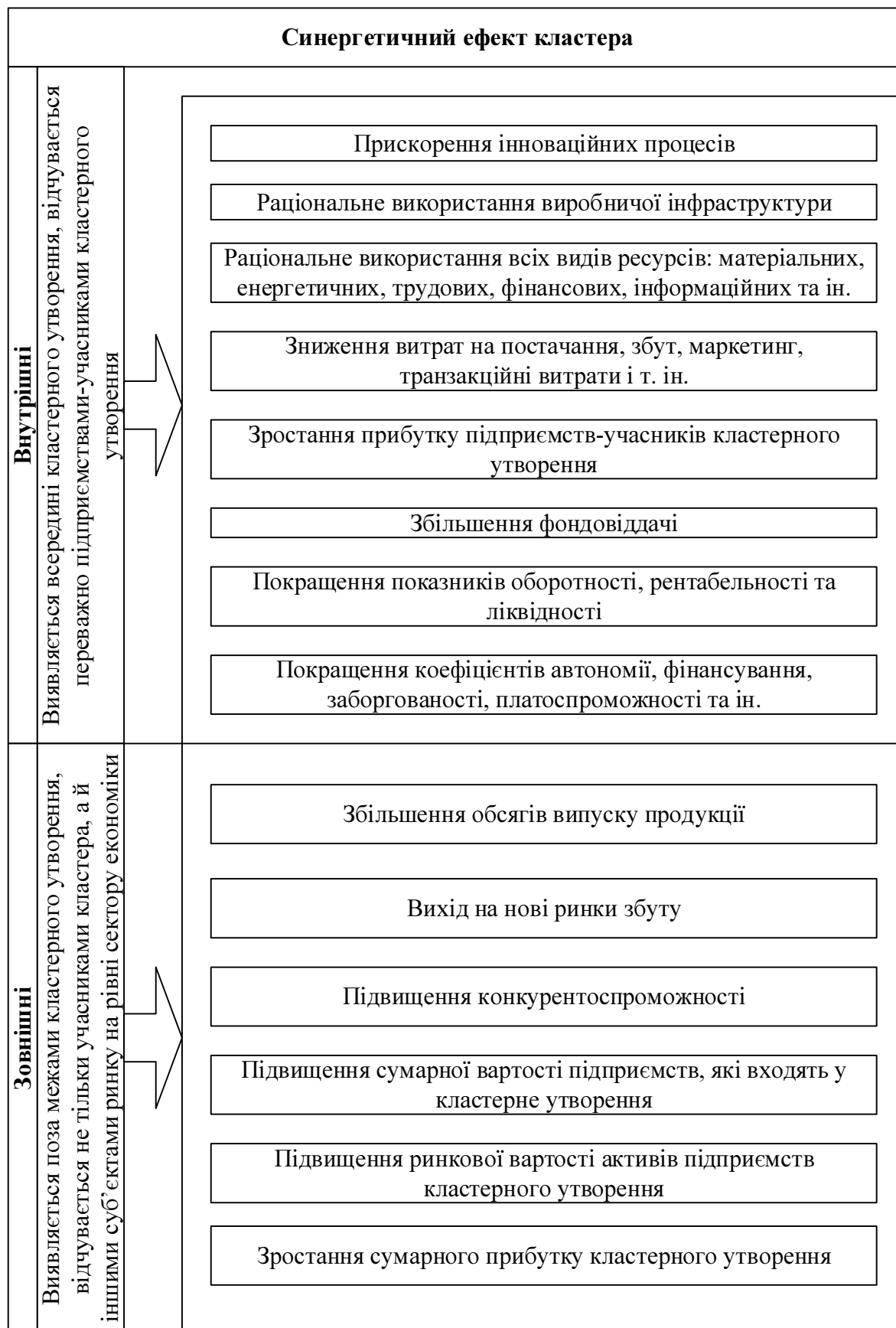
Рис. 3. Складові синергетичного ефекту кластера