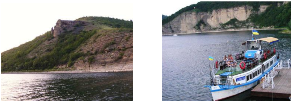
Рис. 5. Дністерський каньйон у с. Врублівцях Fig. 5. Dniester canyon in the village Wrubliwci

Іншим варіантом водного маршруту є сплав р. Дністер із с. Окопів вниз за течією до Бакотської затоки. Об'єктами показу із води буде Хотинський замок та геологічні відслонення у с. Устя, с. Велика Слобідка, с. Врублівцях, де розташована туристична база “Ксенія”, що володіє плавзасобами. На базі можна заночувати (рис. 5)