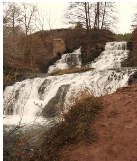
Рис. 3. Джуринський водопад