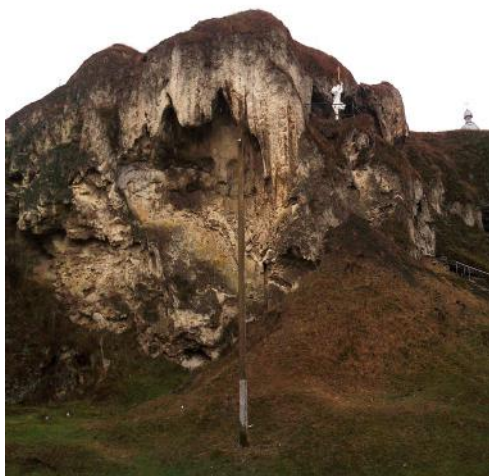
Рис. 2. Рукомишські скелі

Екскурсійний маршрут до с. Рукомиш і після нього можна доповнити історико-архітектурними, релігійними, оборонними спорудами та іншими екскурсійними об'єктами смт Микулинці, с. Дружба, с. Струсів, (до нього) та м. Бучач, с. Язлівець (після нього), а також заїздом на Русилівський та Джуринський водоспади і так аж до самого Дністерського каньйону (рис. 3).