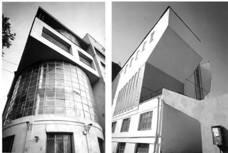
Рис. 6.1. Клуб им. Зуева. И. Голосов. 1929 г. Рис.6.2. Клуб им. Русакова. К. Мельников. 1929 г.