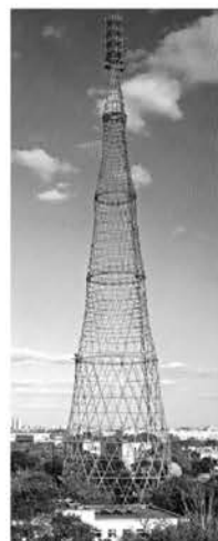
Рис. 5.1. Гараж. К. Мельников. 1936 г. Рис. 5.2. Башня Шухова. 1920 г.

Теперь эти здания вошли в Фонд Всемирного Наследия [2] и включены в список DOCOMOMO (International Working Party for Documentation and Conservation of Building, Sites and Neighborhoods of the Modern Movement) в 2000 г. как десять памятников архитектурного авангарда в Москве.