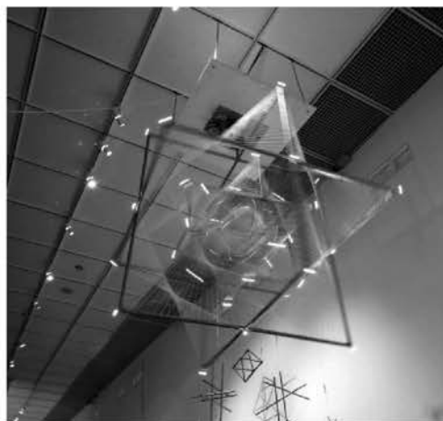
Рис. 1. «Пространство, движение, бесконечность». Инфанте-Арана Франсиско. 1963 г.