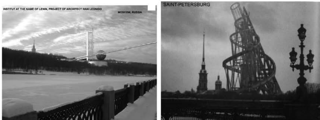
Рис. 8.1. Институт им. Ленина. И. Леонидов. Рис.8.2. Башня «Памятник III Интернационала». В. Татлин. Коллаж. Такехико Нагакура. 1998

Идеи русского авангарда до сих пор обладают поразительной жизненной силой. Любопытно отметить отдельные попытки реализации в современных условиях невоплощенных в свое время проектов архитектурного авангарда. Например, в Москве предложены к осуществлению проекты Ивана Леонидова (рис. 8.1). Японским архитектором Такехико Нагакура сделана попытка увидеть в Санкт - Петербурге 400-метровую Башню Татлина (рис. 8.2.).