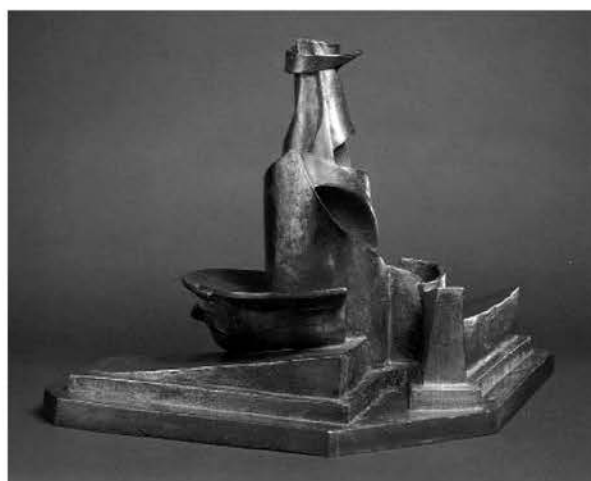
Рис. 3. 1. «Развитие бутылки в пространстве». У. Боччони. 1912 г.