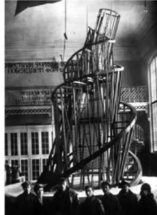
Рис. 4.1. Памятник III Интернационала. Рис. 4.2. Памятник III Интернационала.