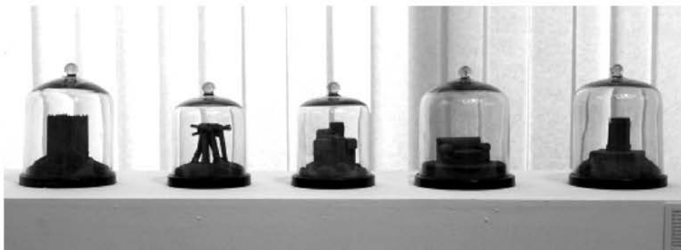
Рис. 2. «Пыльные модели». С. Волков. 1996 г.