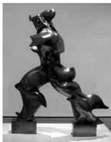
Рис. 3.2. «Уникальные формы непрерывности в пространстве». У. Боччони. 1913 г.