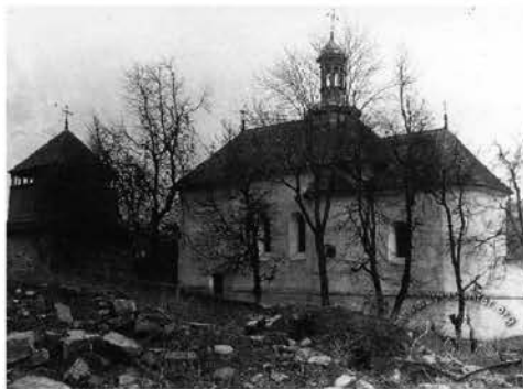
Рис.3. Загальний вигляд Миколаївської церкви з дзвіницею в Бучачі(фото 1930-х рр.)