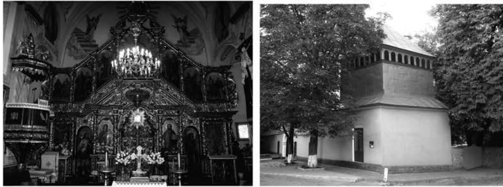
Рис.5. Іконостас Миколаївської церкви (фото 2009 р.) Рис.6. Дзвіниця Миколаївської церкви 2009 р. (фото 2009 р.)