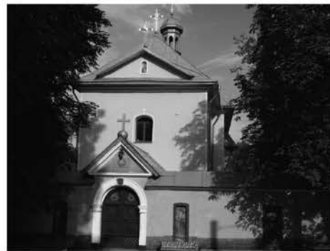
Рис.4. Загальний вигляд сучасної (фото 2009 р.)