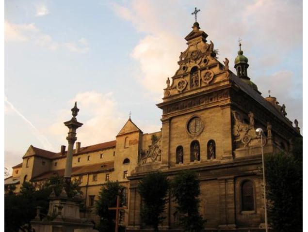
Рис. 2. Львов. Костёл бернардинцев, 1600–1630 гг., арх. П. Римлянин, А. Прихильный