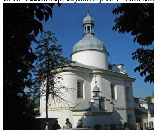
Рис. 10. Бучач. Церковь Покровы опеки Матери Божьей, 1764 г., арх. Б. Меретин