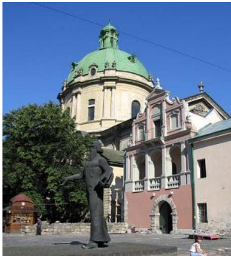
Рис. 3. Львов. Королевский арсенал, 1630 г., арх. П. Гвоздицкий