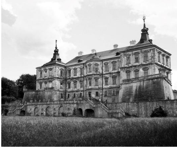
Рис. 1. Подгорцы. Замок, 1635–1640 гг., арх. Винченцо Скамоцци