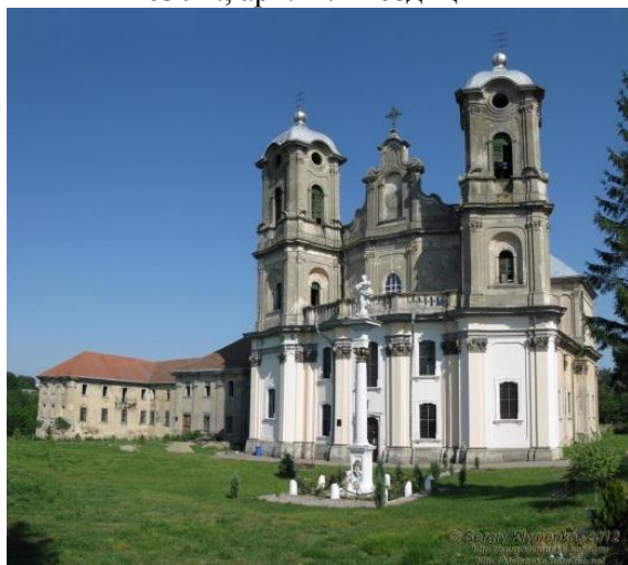
Рис. 5. Городянка. Костёл монастыря Театинского ордена, 1743–1760 гг., арх. Б. Меретин, скульптор И. Г. Пинзель