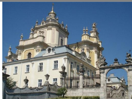
Рис. 8. Львов. Собор Св. Юра, 1744–1762 гг., арх. Б. Меретин, С. К. Фессингер, скульптор И. Г. Пинзель