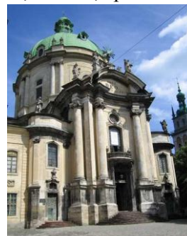
Рис. 12. Львов. Костёл доминиканского монастыря, 1754–1779 гг., арх. Мартин Урбанек, инженер-архитектор Ян де Витт