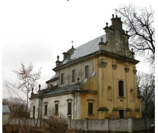
Рис. 4. Навария. Костёл Успения Пресвятой Девы Марии, 1748 г., арх. Б. Меретин