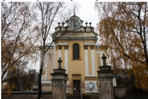
Рис. 11. Бучач. Костёл Успения Матери Божьей, 1761–1763 гг.