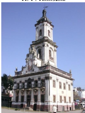
Рис. 9. Бучач. Ратуша, 1750 г., арх. Б. Меретин, скульптор И. Г. Пинзель