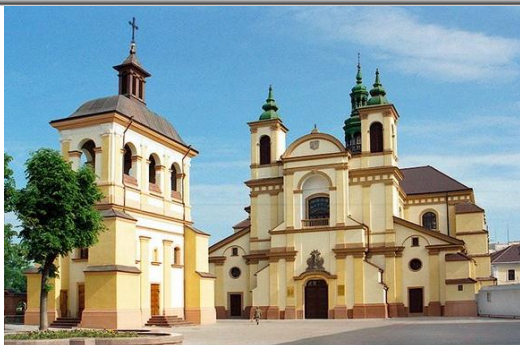
Рис. 7. Ивано-Франковск. Коллегиум и костёл иезуитов, 1703–1742 гг., скульптор И. Г. Пинзель