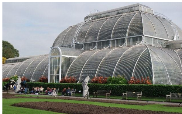
Рис. 6. Оранжерея “Дом пальм” в западной части Лондона