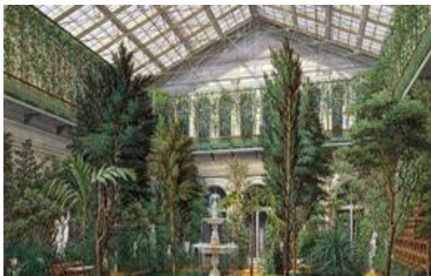
Рис. 1. Эпоха Ренессанса вернула Риму всю красоту оранжерей

На сегодняшний день именно металлический каркас из алюминиевого профиля зарекомендовал себя как отличный материал для фасадного остекления зданий любых типов. Благодаря легкому весу их можно использовать в старых зданиях, которые могут не выдержать большой нагрузки на несущие конструкции. Алюминиевый профиль для фасадного остекления легко подвергается обработке, из него можно делать сложные конструкции, что позволяет воплотить в жизнь любую задумку дизайнера. Стены зимнего сада делаются из стекла, поликарбоната. Для зимнего сада лучше применять стекла с высокими показателями теплоизоляции. Для крыши применяется закаленное стекло или триплекс с надежной и прочной фурнитурой. Чтобы избавиться от запотевания стекол можно использовать стеклопакеты с электроподогревом. Материалы для остекления зимнего сада: энергосберегающие стекла; армированные стекла; стеклопакеты; стекла, окрашенные в массу; закаленные стекла; солнцезащитные стекла; триплекс (ламинированные стекла). Основные функции стекол: теплоизоляция; звукоизоляция; защита от внешней среды; эстетичный вид [6].