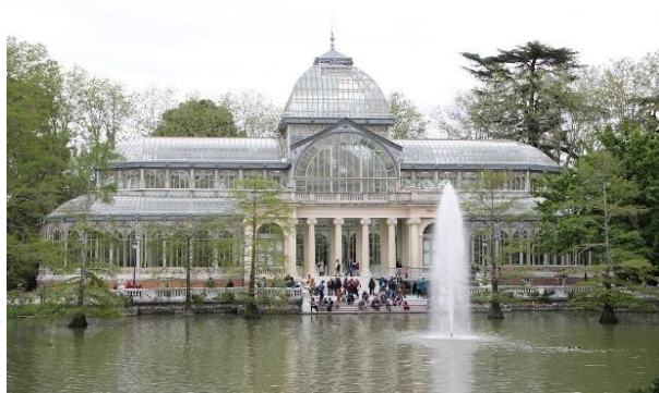
Рис. 5. Зимний сад в Хельсинки, Финляндия