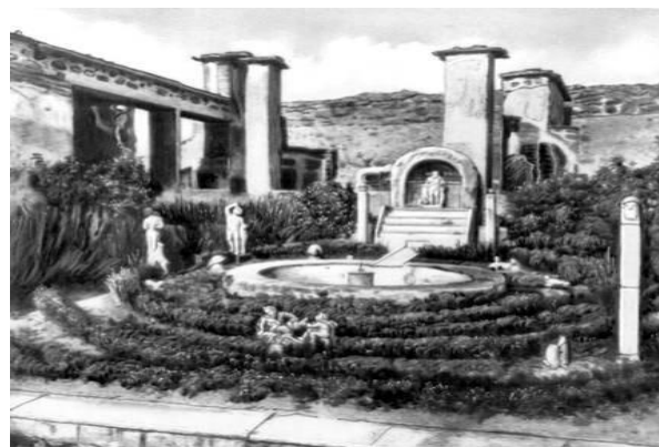
Рис. 2. Впервые зимние сады появились в Древнем Риме