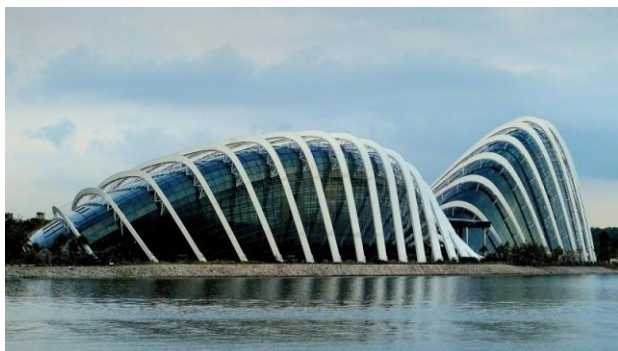
Рис. 3. Сады у залива Марина-бей, в Сингапуре