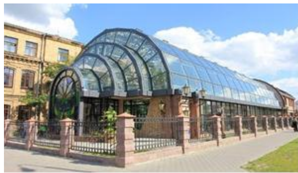
Рис. 4. Зимний сад в Бресте, Беларусь