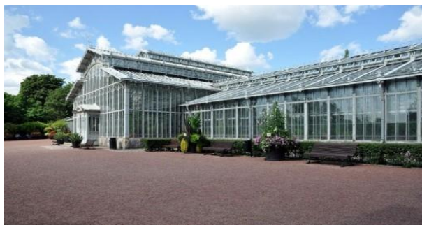
Рис. 7. Хрустальный дворец, в центральном парке Мадрида «Ретиро», Испания