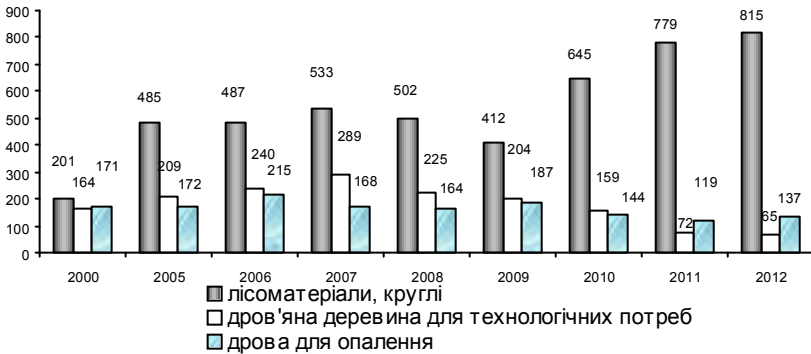
Рис. 2. Заготівля ліквідної деревини за категоріями технічної придатності у Волинській області

Зелені насадження мають меліоративне, водоохоронне і вітрозахисне значення. Зменшуючи силу вітру, завдяки величезній фільтрувальній поверхні листяного покриву, дерева сприяють осіданню пилових частинок. Повітря на озелених вулицях в 4 рази чистіше, ніж на ділянках, які не мають зеленого покриву.