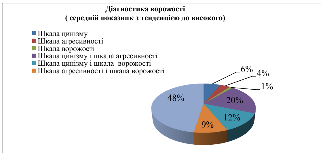
Рис. 6. Результати діагностики ворожості (середній показник з тенденцією до високого)

Середній показник з тенденцією до низького за шкалою цинізму у 1 студента (5%); за шкалою агресивності у 1 студента (5%); за шкалою ворожості у 15 студентів (79%);