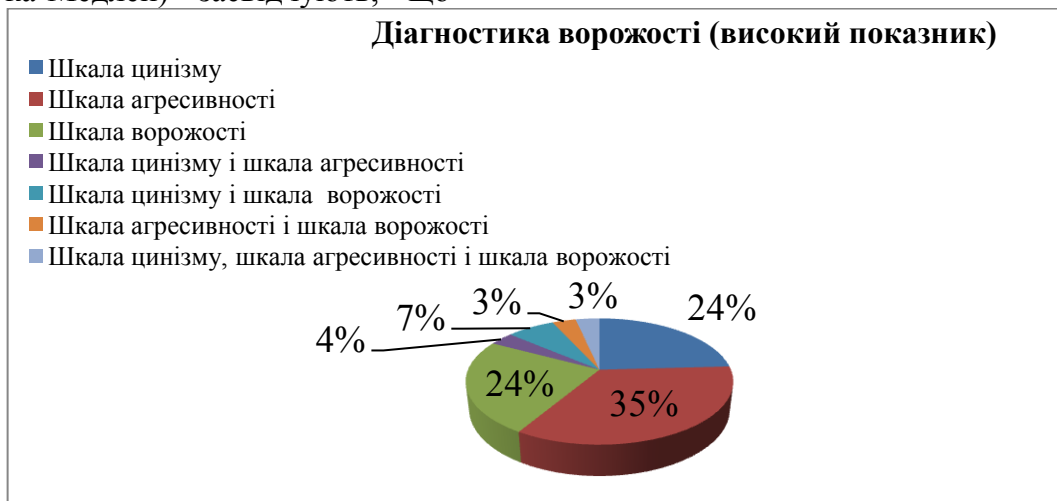
Рис. 5. Результати діагностики ворожості (високий показник)

високий показник за шкалою цинізму у 7 студентів (24%); за шкалою агресивності у 10 студентів (35%); за шкалою ворожості у 7 студентів (35%); одночасно за шкалами цинізму та агресивності у 1 студента (4%); за шкалами цинізму і ворожості у 2 студентів (7%); за шкалами агресивності та ворожості у 1 студента (3%) та за шкалами цинізму, агресивності та ворожості у 1 студента (3%). Результати представлені на рис. 5.