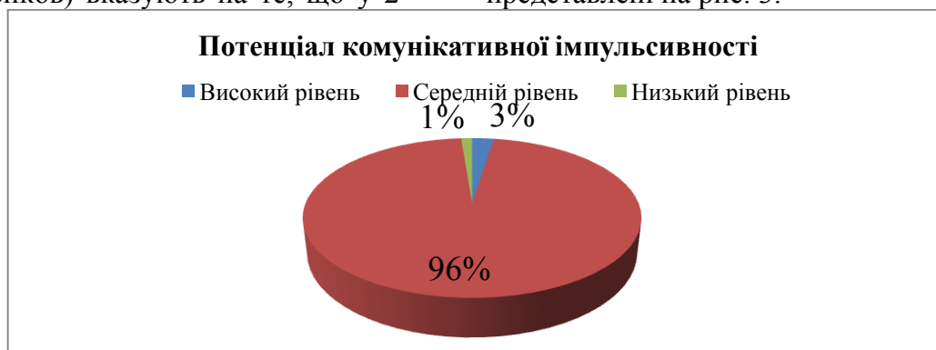
Рис. 3. Результати діагностики комунікативної імпульсивності

осіб (3%) комунікативна імпульсивність на високому рівні; у 77 осіб (96%) – на середньому рівні; у 1 особи (1%) – на низькому рівні. Результати діагностики представлені на рис. 3.