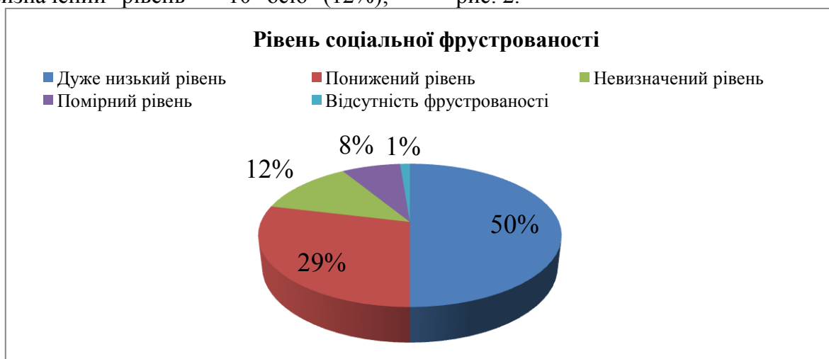
Рис. 2. Результати діагностики соціальної фрустрованості

помірний рівень – 6 осіб (8%); у однієї особи відсутня фрустрованість (1%). Результати діагностики представлені на рис. 2.