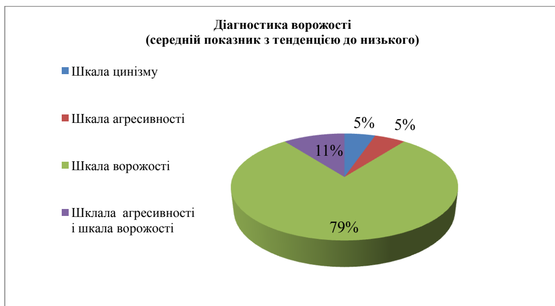
Рис. 7. Результати діагностики ворожості (середній показник з тенденцією до низького)

за шкалами агресивності та ворожості у 2 студентів (11%). Результати діагностики ворожості (середній показник з тенденцією до низького) представлені на рис. 7.