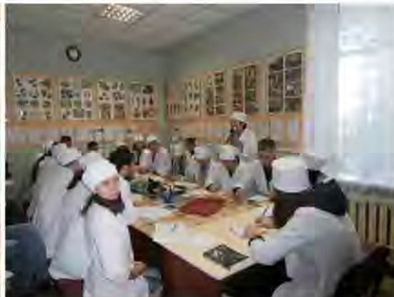
Лабораторне заняття з ветсанекспертизи рослинних харчових продуктів в навчальній лабораторії кафедри (заняття із спеціалізації)

З курсу «Ветеринарно-санітарна експертиза з основами технології і стандартизації продуктів тваринництва» проводиться навчальна практика на переробних підприємствах, державних лабораторіях ветеринарної медицини і лабораторіях ветеринарно-санітарної експертизи, лабораторіях науково-дослідних інститутів.