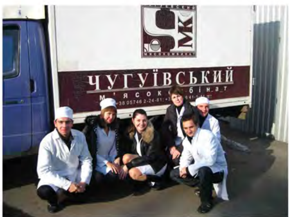
Виїздне практичне заняття з ветсанекспертизи на Чугуївському м'ясокомбінаті Харківської області