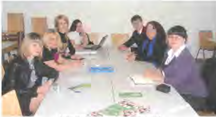
Міжнародний проект "Темпус"

обговорюються питання навчального, методичного, наукового характеру, забезпеченості занять, виконання співробітниками доручень, стан кураторської роботи викладачів.