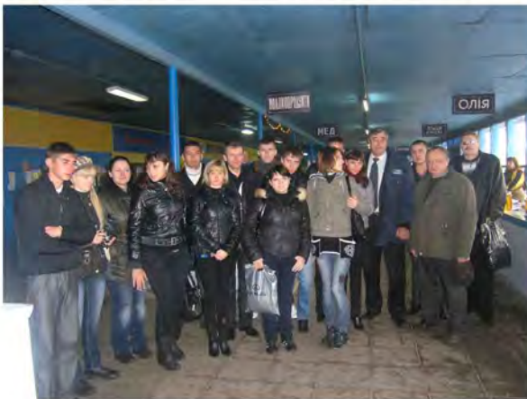
Ознайомлення з роботою державної лабораторії ветсанекспертизи на ринку м. Богодухів