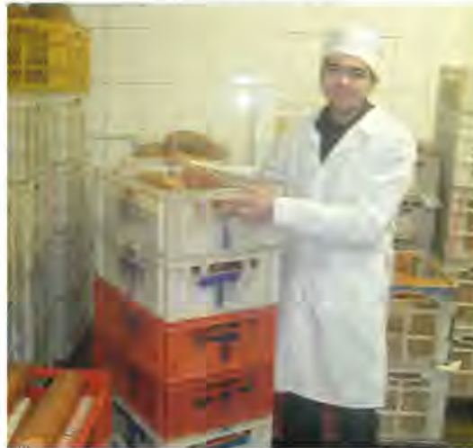
Виробнича практика студентів на Чугуївському м'ясокомбінаті Харківської області