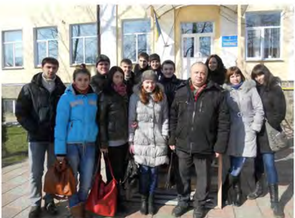
Практичне заняття з ветсанекспертизи в умовах Харківської регіональної лабораторії ветеринарної медицини