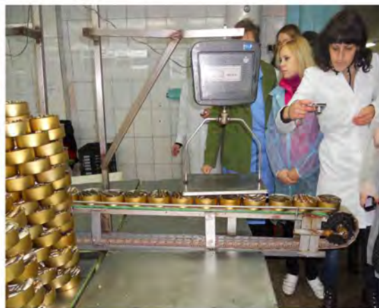
Ознайомлення з технологією виробництва рибних консервів на Богодухівському рибоконсервному заводі «Екватор».