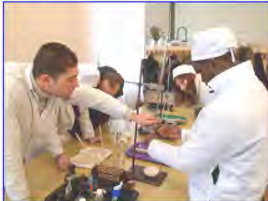
Лабораторні заняття з ветсанекспертизи на кафедрі

Вже більше 10-и років в академії на факультеті ветеринарної медицини введено спеціалізацію в т.ч. з ветеринарно-санітарної експертизи. Під час занять студенти поглиблено