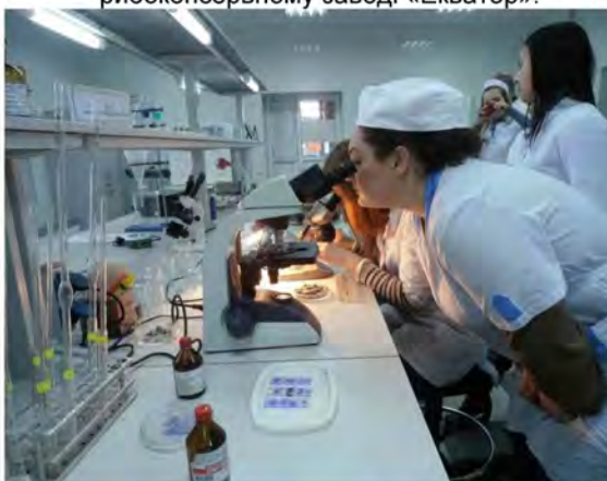
Практичне заняття з ветсанекспертизи в умовах державної лабораторії ветсанекспертизи Центрального ринку (м. Харків)