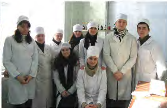
Лабораторне заняття в лабораторії молекулярно-генетичних методів досліджень ім. П.І. Вербицького ХДЗВА: «Виявлення збудників харчових токсикоінфекцій».

Активно збагачується матеріально-технічна і науково-методична база: придбані нові інструменти, обладнання, прилади; виготовлено наглядні посібники (стенди, таблиці, муляжі); виготовлено заморожені та засушені об'єкти ветеринарно-санітарної експертизи (тушки риби, тушка качки, тушка фазана, тушка курки, тушка кроля і нутрії, голова свиняча з розпрепарованими лімфатичними вузлами, великим жувальким і криловим м'язами, окремі внутрішні органи різних видів тварин) створено мультимедійні лекційні посібники на електронних носіях; розроблено робочі зошити для лабораторних робіт з усіх дисциплін, що викладаються на кафедрі. Під час підготовки фахівців з ветеринарно-санітарної експертизи, якості і безпеки продукції тваринництва особлива увага приділяється практичним питанням і використанню живих об'єктів у навчальному процесі, продуктам харчування та сировині тваринного походження.