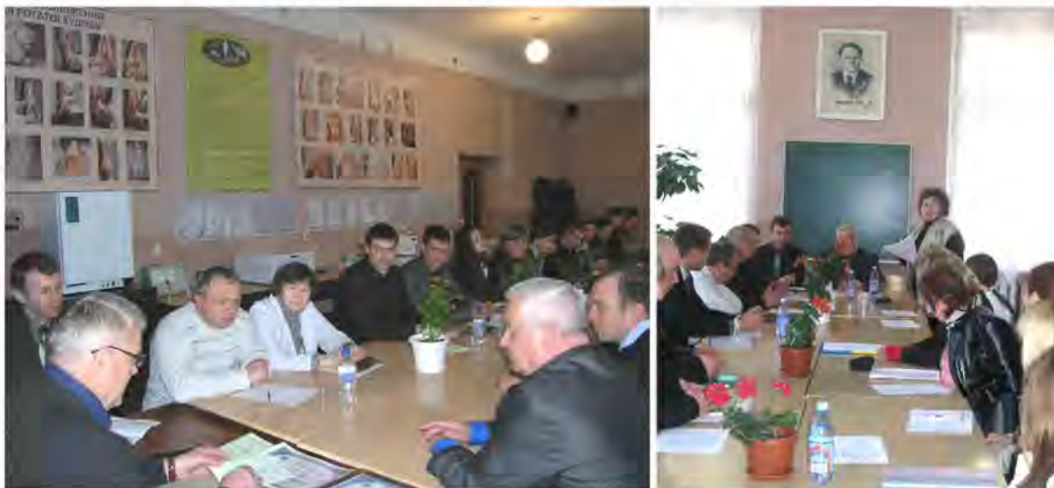
Наукова конференція студентів та магістрантів «Практичні та теоретичні досягнення молодих науковців-аграріїв» (11.04.2013 р.) на кафедрі ветеринарно-санітарної експертизи та судової ветеринарної медицини

Кафедра ветеринарно-санітарної експертизи та судової ветеринарної медицини активно співпрацює з іншими кафедрами Харківської державної зооветеринарної академії, а також із спорідненими кафедрами інших ВУЗів України: кафедрою ветеринарно-санітарної експертизи Національного університету біоресурсів і природокористування України (м. Київ), кафедрою ветеринарно-санітарної та радіологічної експертизи Львівського національного університету ветеринарної медицини та біотехнологій ім. С.З. Гжицького, кафедрою паразитології та ветсанекспертизи Дніпропетровського державного аграрного університету тощо, Інститутом судових експертиз ім. Бокаріуса (м. Харків), лабораторією біобезпеки і екологічного контролю ресурсів АПК Дніпропетровського ДАУ, ННЦ «Інститут експериментальної і клінічної ветеринарної медицини», (м. Харків), що дозволяє обмінюватись досвідом, новими ідеями, створювати концептуальні підходи до викладання дисциплін, особливо нововведених, що позитивно відображається на викладацькій діяльності.