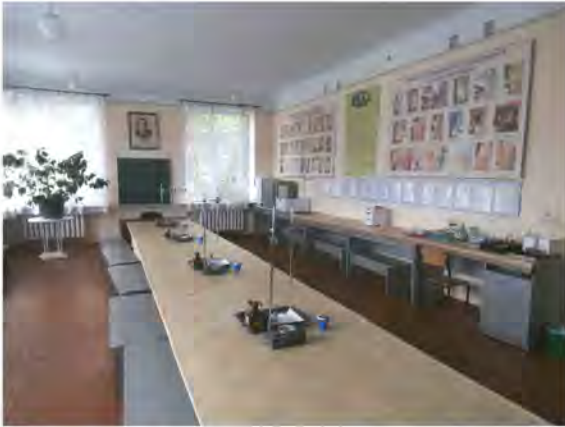
Лабораторія ветеринарно-санітарної експертизи м'яса і м'ясних продуктів ім. В.П. Образцова

регулярних виїзних заняттях на переробні підприємства, в лабораторії та НДІ України (м. Богодухів: рибкомбінат «Екватор», агропродовольчий ринок, м'ясокомбінат; м. Чугуїв: м'ясокомбінат; м. Харків: державна лабораторія ветеринарно-санітарної експертизи Центрального ринку, регіонарна лабораторія ветеринарної медицини, НДІ жирів і масел, НДІ тваринництва). Ці моменти навчального процесу неодноразово висвітлювалися в газетах «Темпус» та «Вісті Дергачівщини».