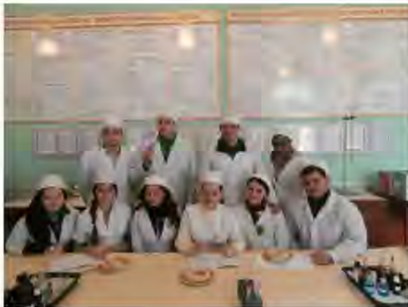
Технологія приготування та ветсанекспертиза домашньої ковбаси в навчальній лабораторії кафедри (заняття із спеціалізації)

опановують теми, які не входять в програму вивчення ветсанекспертизи на загальному потоці. Серед них: «Особливості ветсанекспертизи рослинних харчових продуктів у сучасних умовах, згідно загальнодержавної програми органічного виробництва», «Ветеринарно-санітарний контроль за показниками якості та безпечності продуктів харчування, згідно Закону України «Про державну систему біобезпеки при створенні, випробуванні, транспортуванні та використанні ГМО», «Особливості виробництва функціональних молочних продуктів та їх ветеринарно-санітарна оцінка», «Особливості ветеринарно-санітарного контролю на м'ясопереробних підприємствах в Україні та країнах ЄС», «Ветеринарно-санітарна експертиза сухих молочних продуктів», «Ветеринарно-санітарна експертиза морозива», «Ветеринарно-санітарна експертиза молочних консервів» тощо.