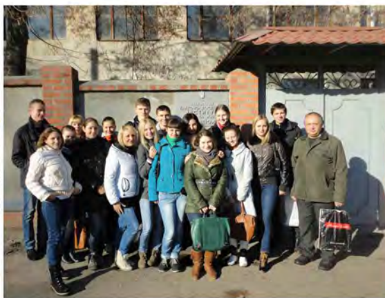
Практичне заняття з ветсанекспертизи в умовах НДІ жирів і масел (м. Харків)