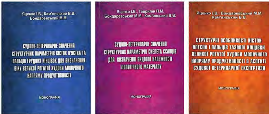
Монографії написані науково-педагогічними працівниками кафедри (2009-2014 рр.)

Викладачами кафедри підготовлено і видруковано 5 монографій: «Структурні особливості кісток плесна і тазової кінцівки великої рогатої худоби молочного напрямку продуктивності в аспекті судової ветеринарної експертизи» [21], «Судово-ветеринарне значення структурних параметрів скелета ссавців для визначення видової належності біологічного матеріалу» [22], «Судово-ветеринарне значення параметрів кісток п'ястка та пальців грудних кінцівок для визначення віку великої рогатої худоби молочного напрямку продуктивності» [23], «Структурні особливості кісток великої рогатої худоби молочного напрямку продуктивності в аспекті судово-ветеринарної експертизи» [24], «Ветеринарно-санітарний контроль убоя овець при овисном цистицеркозе» [26].