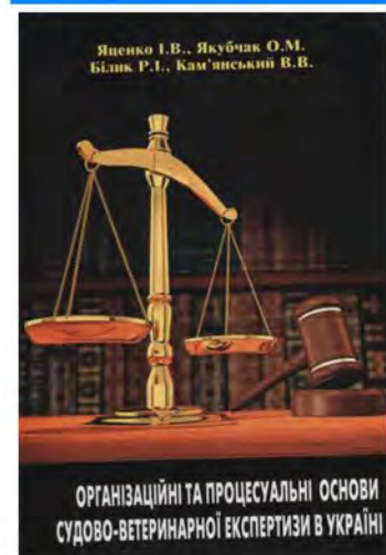
Деякі навчальні та навчально-методичні посібники, написані науково-педагогічними працівниками кафедри (2009-2014 рр.)