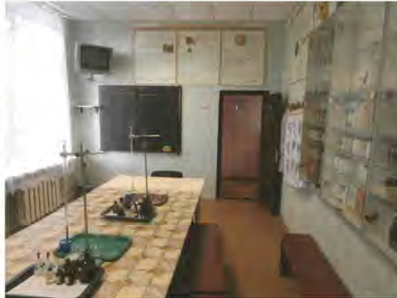
Лабораторія ветеринарно-санітарної експертизи харчових тваринних гідробіонтів, апіпродуктів та рослинних харчових продуктів