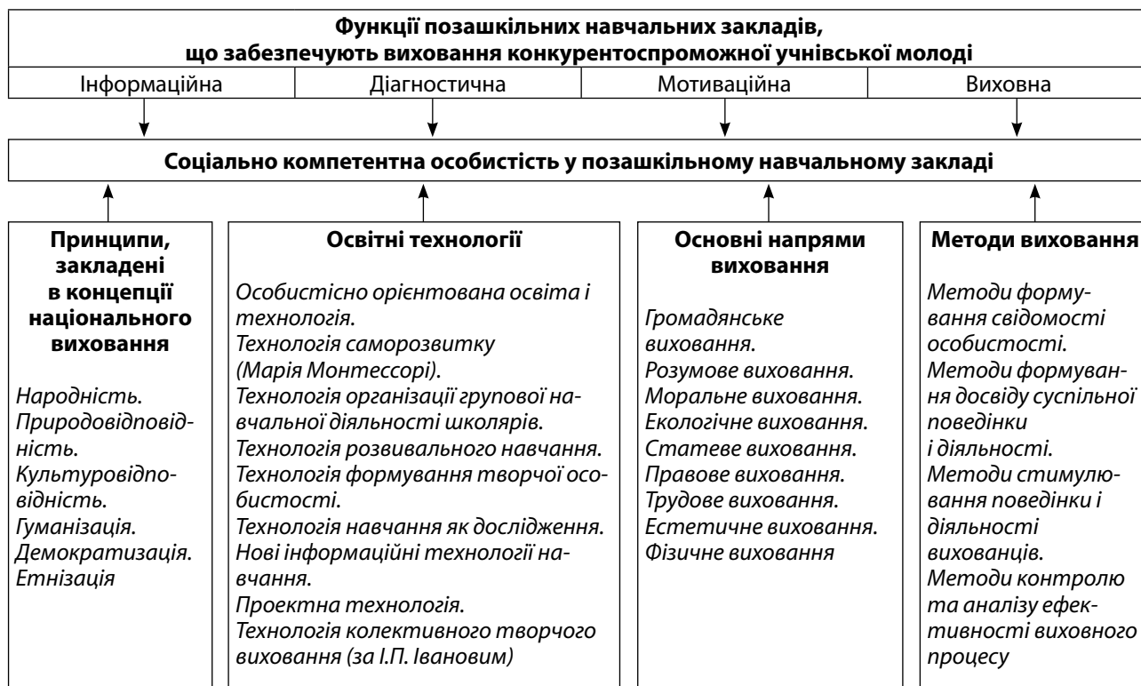
Рис. 2. Модель формування соціально компетентної особистості в позашкільному середовищі відповідно до вимог Болонського процесу

Було визначено також п'ять основних особливостей стратегії навчання впродовж життя: