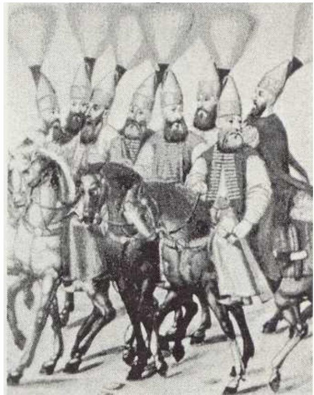
Малюнок 4. Вищі офіцери яничарського корпусу, так званого катарагалари (від катар – караван). На кожному – спеціальні головні убори (чорбаджи) з повстини у вигляді циліндра із високою кінцівкою, до якої кріпився великий султан.

Так само кожна яничарська орта мала також свою емблематику (див. малюнок № 6), причому ці зображення подавалися на брамах казарм, де перебували яничари, наметах, яничарських штандартах і прапорах, могильних каменях, і навіть на тілі та руках яничар у вигляді татувань 12 .