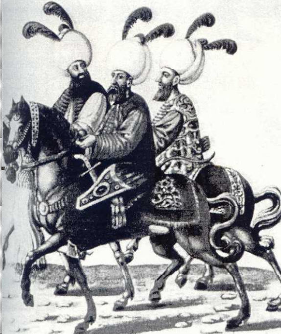
Малюнок 3. Чавуши (старші офіцери яничарського корпусу). До сидла кожного прикріплено сагайдак зі стрілами, лук і шаблю. На головах – усюфи з пір'ям лелеки, вдягнені у плащі (ферадже) із сукна на хутрі.

єму прапору також мав неофіційну назву кормизи байрак («червонопрапорний»). Нарешті у середині XV ст. до бьолюків сіляхдар і сіпахі було додано ще два – кінні загони правих і лівих улuffedжи 11 , які йшли в бій під зеленими прапорами.