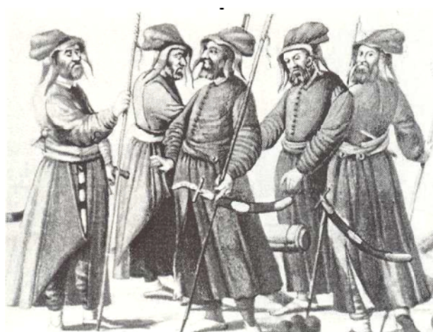
Малюнок 2. Османські гармаші ( топчу ). Кожний озброєний шаблею та тримає у руці довгу тонку палицю із прикріпленим до неї труттом для запалювання гарматних запалів. У центрі малюнка фрагмент жерла гармати, біля якої складено ядра невеликого калібру.

Під час боїв кожному яничару видавали зброю – зроблений з рогу лук, комплект стріл,