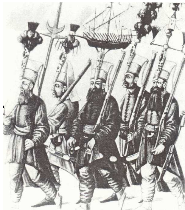
Малюнок 1. Яничари під час виконання ними церемоніальних функцій. До бьорків прикріплені спеціальні конструкції із макетами вітрильника (в центрі) та бапти фортеці (крайній праворуч). У кожного із зображених на малюнку яничарів – мушкет і шабля, у крайнього ліворуч ще й спис із кінцівкою спеціальної форми.

Комплект одягу яничара включав широкий каптан блакитного або синього кольору, верхній одяг – довга (до п'ят) долома з широкими рукавами, на яку ще й надягався плащ ( барані ). Крім того яничари носили вузькі шаровари та чоботи різного кольору залежно від їхнього рангу (вищі чини – жовті, старші офіцери – червоні, молодші – чорні). Яничарським чорбаджи (букв. «роздавальник супу», командир підрозділу) видавалось для пошиття шинелі сукно зеленого кольору ( собрамані ). Всім офіцерам яничарського корпусу комплект одягу видавався двічі на рік (літній комплект називався бахаріє , зимовий – земістаніє ) 5 . Найприкметнішою та ексклюзивною ознакою приналежності до яничарського корпусу були бьорки 6 , які тривалий час виготовлялись у спеціальній майстерні при яничарському корпусі.