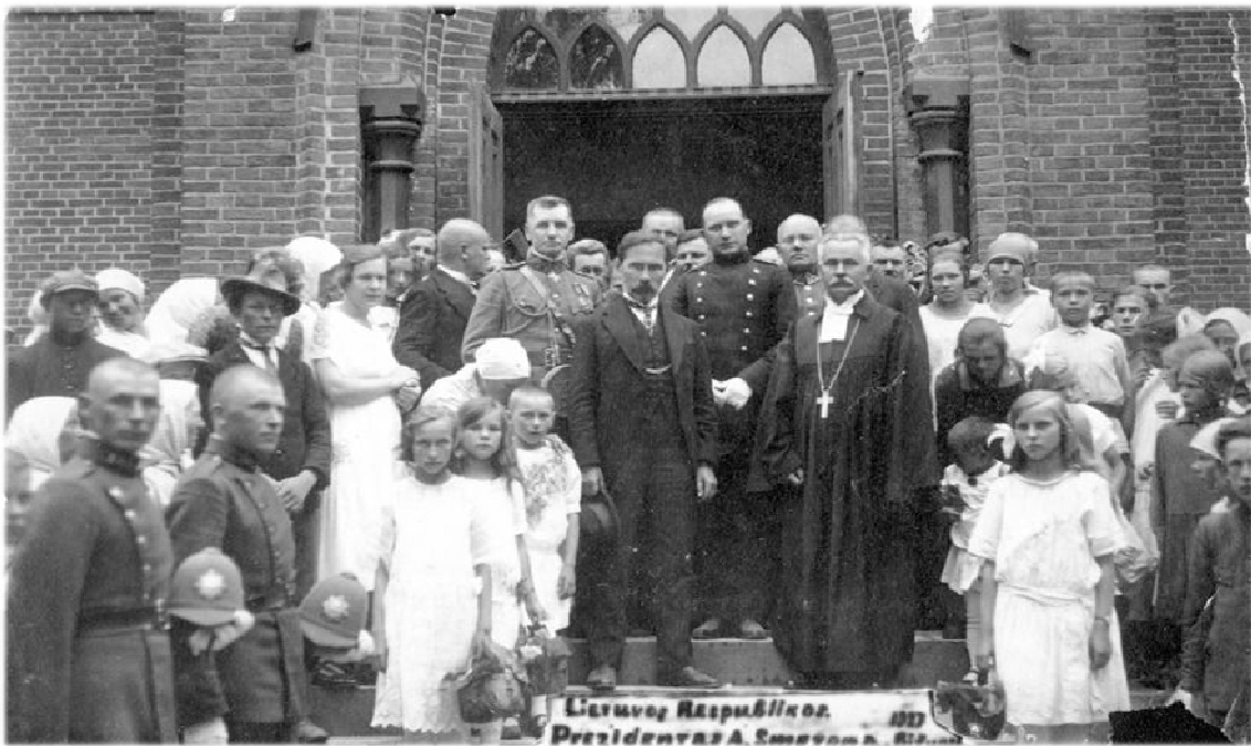
Фото 2. Принцип «Литва для всіх» в дії. «Дарований Провидінням» відвідує протестантську общину під час мандрівки країною. 1927 р.