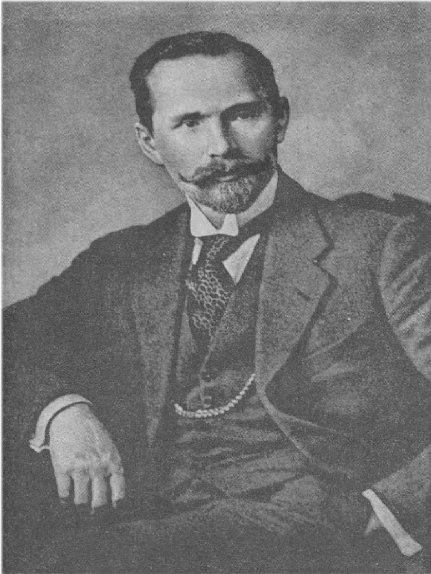
Фото 3. Типовий фотопортрет А. Сметони доби «литовського тріумвірату» (1926–1929). На цьому етапі, за задумом пропагандистів президент мав уособлювати поєднання аристократизму, інтелігентності, імпазантності та стилю.