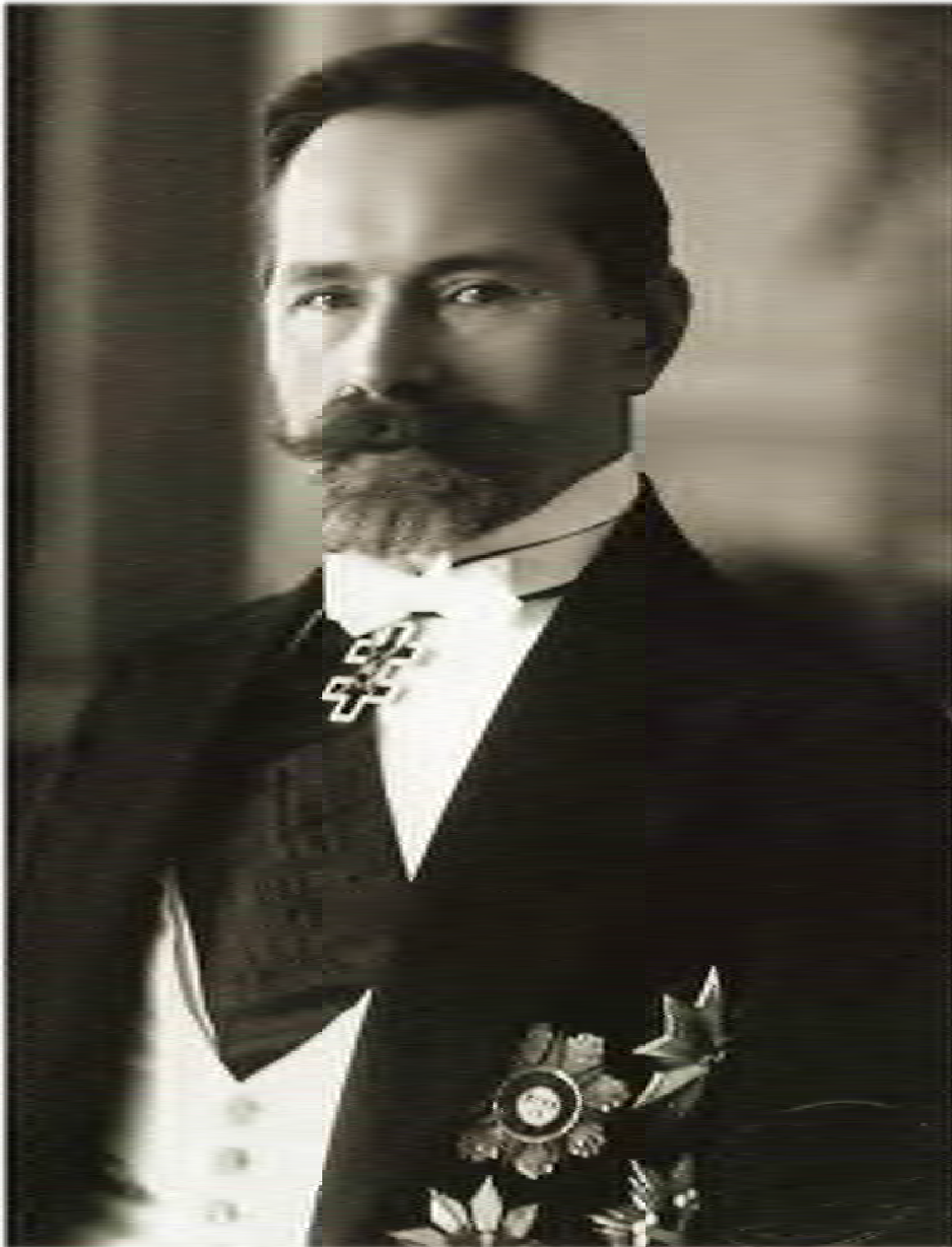
Фото 4. «Антанас Сметона – Президент Литовської республіки». Офіційний портрет характерний для періоду автократичного правління (1929–1940). «Вождь» на ньому «еталон шляхетності», «концентрація владності та сили».