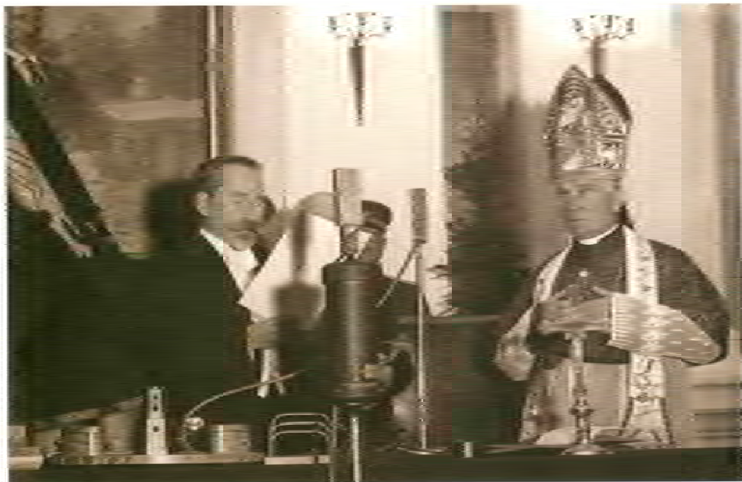
Фото 11. А. Сметона на фоні портрета «Залізного Антанаса» – дні апогею культу «Вождя нації». Фото середини 1930-х рр.