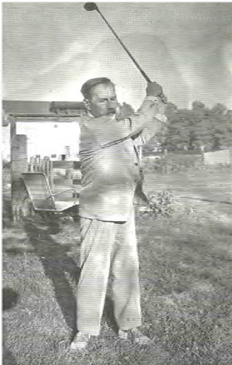
Фото 9. «Головний керманич» за грою в гольф.