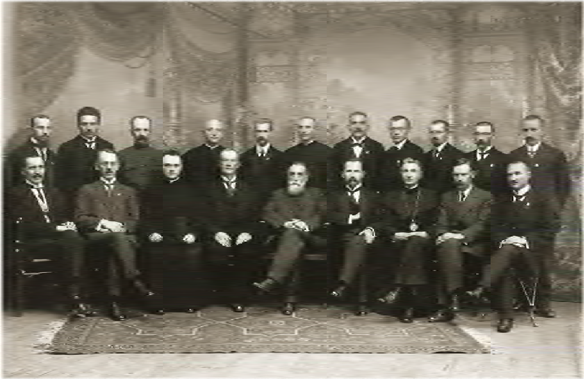
Фото 1. А. Сметона (перший ряд, четвертий праворуч) серед членів Литовської Тариби. 1918 р. [15, с. 153].