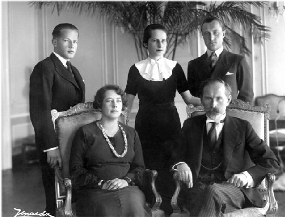
Фото 10. В оточені родини (праворуч від А. Сметони – дружина Софія; стоять зліва направо : син Юліус, дочка Маріте, зять Алоїзас) [16].