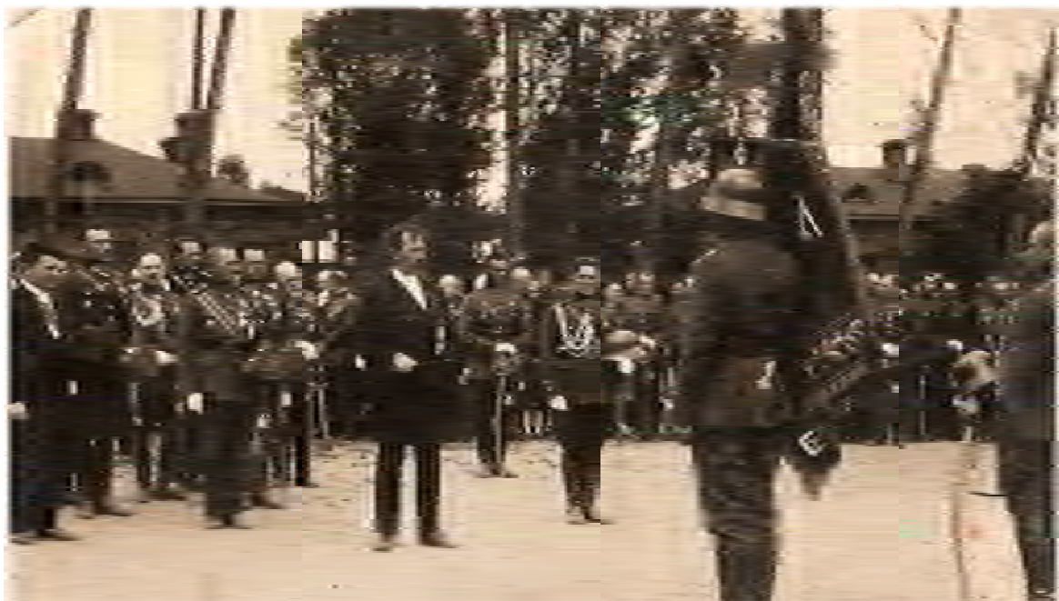
Фото 13. Диктатор та його армія. Президент перед строєм Війська Литовського.