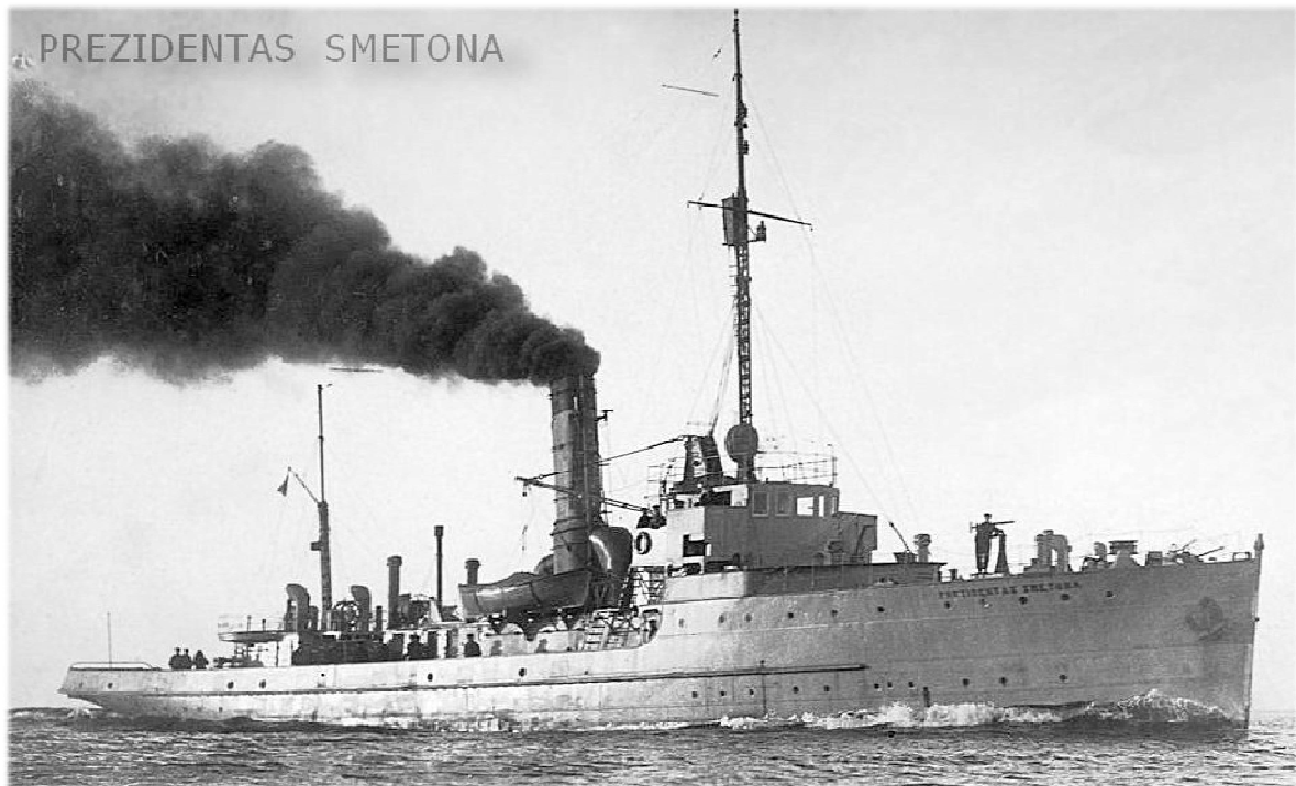
Фото 12. «Президент Сметона» – названий на честь диктатора флагман ВМС Литви. Корабель був побудований у 1917 р. в Німеччині. У 1927 р. за 289 000 літів придбаний литовським урядом у гамбурзької фірми «Бібер» [27].