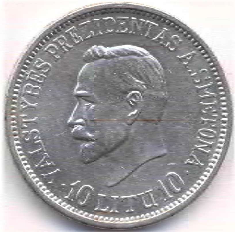
Фото 5. Монета номіналом у 10 літів Першої Литовської республіки з зображенням профіля «Вождя нації».