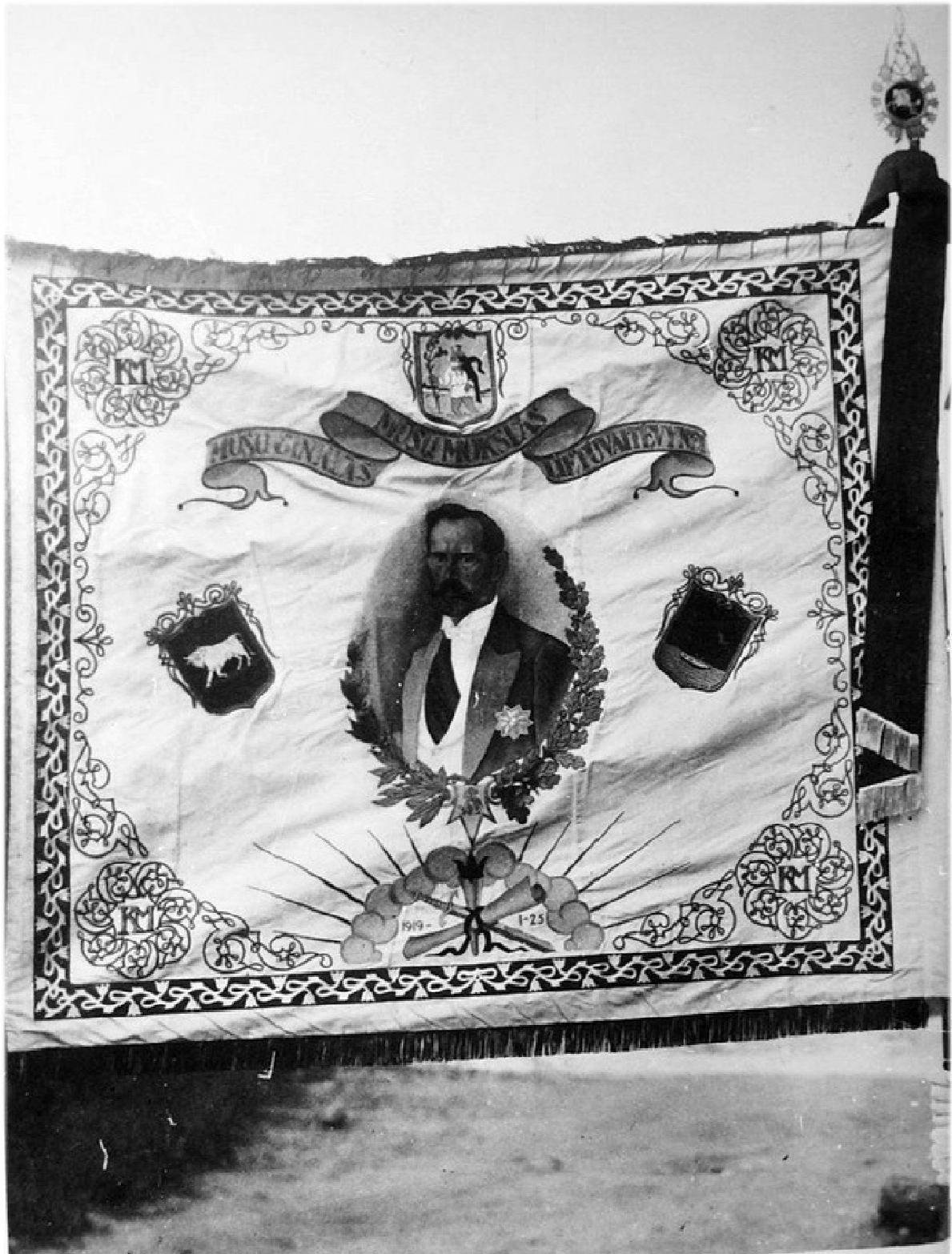
Фото 8. Прапор із зображенням «Дорогого вождя» Каунаської військової школи. 1929 р.