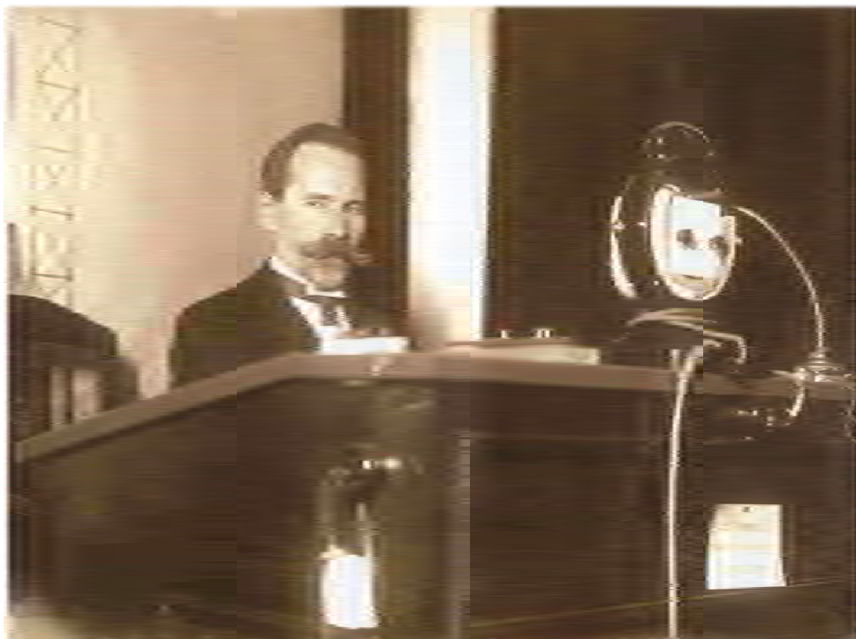
Фото 7. «Правитель-філософ» за кафедрою. Фото 1936 р.