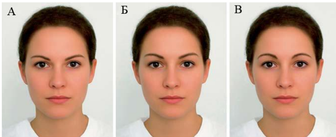
Рис. 2. Різні варіанти форми та висоти положення брів.

Найбільша частина цих жінок була із вікових груп 30–39 та 40–49 років. Слід зауважити, що люди, старші 50 років, віддавали перевагу високо розташованим бровам із максимальною висотою у середній третині. Мабуть, це зумовлено модою на таку форму брів у 60–70-ті роки минулого сторіччя, коли вони були молоді.