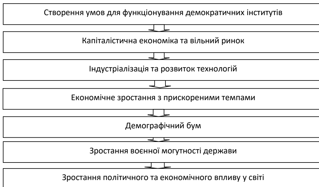
Малюнок 2 – Закономірність у розвитку воєнно-економічного потенціалу Англії XVI – XIX ст.

Те, що Англія стала наймогутнішою морською світовою державою є закономірним адже саме вона була першою країною в якій зник феодальний устрій і зародилися демократичні інститути, які дали поштовх для розвитку ринкової економіки (конкуренції та капіталізму). Відповідно це спонукало до економічної революції, створенню нових форм підприємництва та технологій. Паралельно з ростом економічної могутності росла і воєнна могутність Англії, що зробило її на початок XX ст. найбільшою колоніальною державою світу (мал. 2).