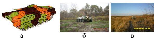
Рис. 2. Маскировочное окрашивание боевой техники: а – летняя БМП; б – весенняя БТР-60ПБ; в – осенняя БТР-70

Маскировочное окрашивание БТТ производится так, что летом зеленый цвет занимает 50% поверхности машины, остальные цвета - по 25%. С наступлением осени-весны 30-50% площади пятен зеленого цвета перекрашиваются в желтый цвет, а в зимнее время до 75% покрывается белым цветом (остальная окраска темным цветом). Их поперечный размер может колебаться от 0,5 до 1,5 м. Пятна вытянутой формы наносятся под углом 30-60° к контурам машины (рис. 2).