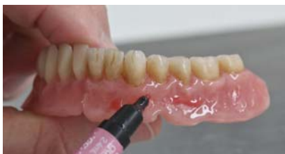
Фото 13. Моделування більш глибоких елементів рельєфу (GM 36).