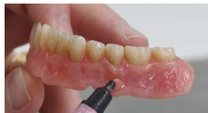
Фото 14. Моделування в апікальній зоні (GM 31).