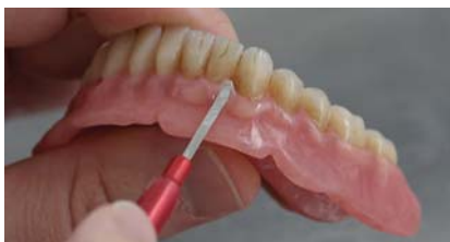
Фото 12. Моделування пришийкових областей ясен (GM 35).