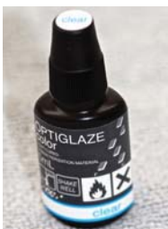
Фото 10. OPTIGLAZE CLEAR можна застосовувати для розведення барвників OPTIGLAZE Color.