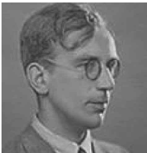
Г. А. Гамов (1904–1968 рр.)

У роботі з єдиної науково-методичної позиції розглянуті три фундаментальні відкриття народженого в Україні професора Григорія Антоновича Гамова, кожне з яких заслуговує на Нобелівську премію – найбільш престижну світову відзнаку досягнень науковців.