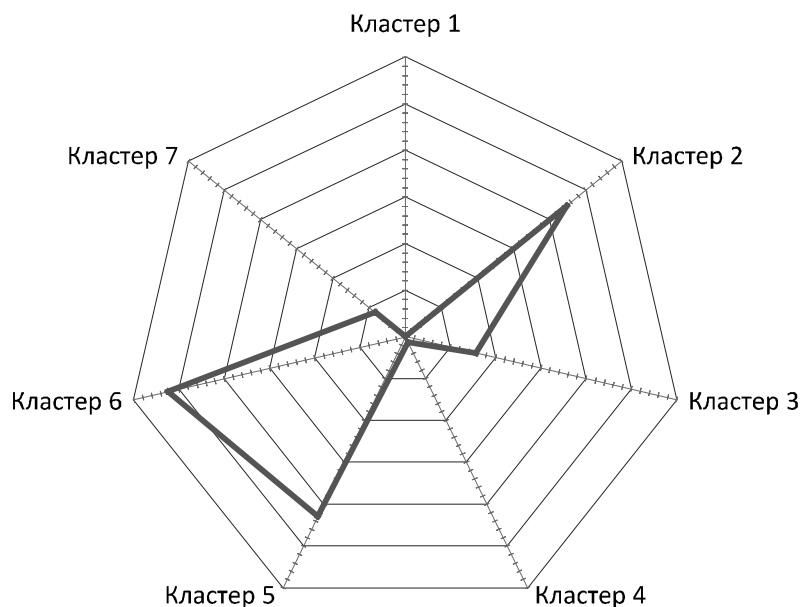
Рис. 3. Графічна інтерпретація ринку перестраховування за результатами кластерного аналізу інтенсивності перестрахової діяльності

запропонувати графічну її інтерпретацію, що, своєю чергою, допомагає однозначно виявляти ринкову позицію будь-якої страхової компанії за обраними ознаками та її потенційних конкурентів.