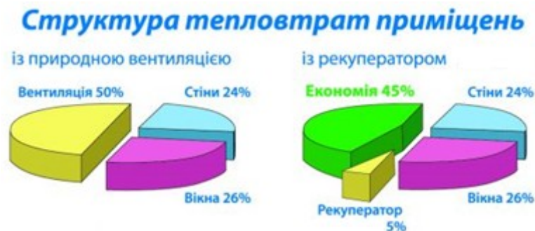
Рис. 2. Ефективність застосування рекуперації

На рис. 2 зображено схему ефективності застосування рекуперації.