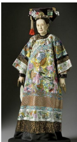
Рис. 2. Одяг маньчжурського типу – «ципао»

Ситуація змінилася тільки в 1920-і роки, коли після повалення династії Цин була оголошена Китайська Республіка. Центром нової моди став Шанхай, а китайські модниці отримали свободу вибору свого власного стилю в одязі. До цього моменту весь Індокитай залишався під сильним впливом Франції, яка вела війни за його колонізацію, причому місцевий істеблїшмент часто ставився до колонізаторам вельми прихильно. Під західним впливом традиційне маньчжурське ципао змінилося до невпізнання: поширився костюм, який щільно облягав фігуру, з високим коміром, укороченими рукавами і розрізами по подолу. Це плаття підкреслювало красу жіночого тіла, воно стало символом нового життя та отримало назву аозай (рис. 3).