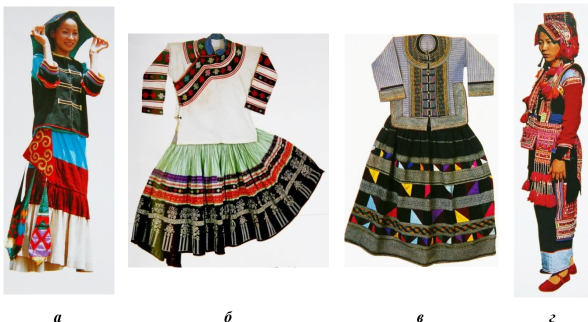
Рис. 4. Традиційний костюм народів В'єтнаму: а – народ «тхай»; б – народ «хмонг»; в – народ «мео ман»; г – народ «мяо»

порядку, прикрашалися полички кофт і халатів, а також головні убори (народ «хани»). Іноді шматочки тканини, з яких складалася аплікація, оформлялися у вигляді лусочок, окантованих вузькою смугою яскравої тканини і заповнених вишивкою. Такий декор характерний для весільного костюма, він символізував луску дракона, що виконувала по відношенню до нареченої захисну функцію [1]. Елементи аплікації, принцип їх чергування її елементів, колірна гамма – надзвичайно різноманітні, і саме в цьому проявилася місцева традиція. Так, наприклад, народи «мяо» нашивали смуги навколо ворота і застібки, чергуючи вузькі, широкі і орнаментовані смуги.