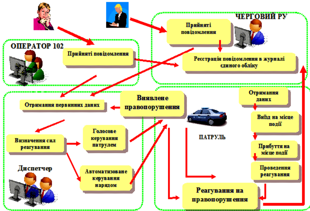
Рисунок 1 – Схема інформаційних потоків системи «ЦУНАМІ»

Як вбачається зі спрощеної схеми інформаційних потоків (рис. 1), повідомлення отримані оператором служби «102» або черговим РВ НП оперативно надходять в електронному вигляді до чергового-диспетчера, який: