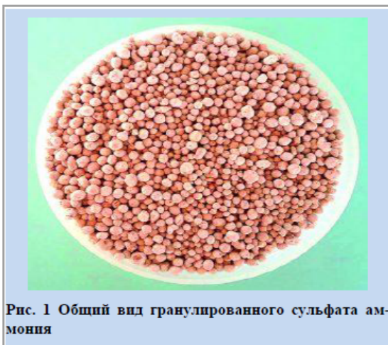
Рис. 1 Общий вид гранулированного сульфата аммония

Другим существенным недостатком подобного сульфата аммония является его слеживаемость при хранении. Мелкокристаллическая структура удобрения в результате сильно развитой поверхности является причиной повышенного содержания в нем влаги, что приводит к слеживанию продукта и срастанию кристаллов в крупные конгломераты. Равномерное распределение такого удобрения в почве сопряжено с большими трудностями. Поэтому большинство удобрений окомковывают в более крупные частицы с удовлетворительными свойствами посредством различных процессов, которые обычно называют «грануляцией».