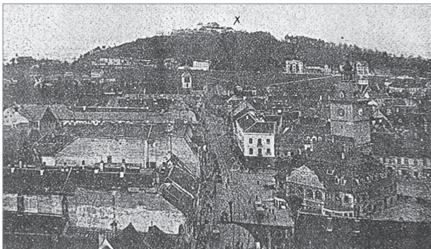
Фото 2. Панорама румунського міста Брашова, де 1 жовтня 1921 року був розміщений український полк під командуванням полковника Гната Порохівського (місце позначено у верхній частині фотографії літерою «X»)

глави Надзвичайної дипломатичної місії Української Народної Республіки в Румунії Костянтина Мацієвича ( фото 3 ), полковник Г. Порохівський був прийнятий особисто королем Румунії Фердинандом I, домагаючись покращання умов для перебування українських військових емігрантів в Румунії. Конкретним результатом наданої румунською стороною підтримки стало їх перерозквартирування в містах Фегераш та Орадя-Маре, де на той час існували кращі умови для життя ( фото 4 ).