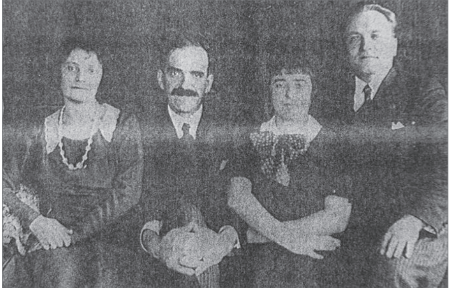
Фото 10. Під час відвідування Бухареста Головою Уряду УНР в екзилі О. Шульгиним (у центрі) з дружиною (ліворуч) та його зустріч з полковником Г. Порохівським (праворуч) з дружиною

На окрему увагу заслуговує той факт, що науковці — представники української еміграції в Румунії від часу прибуття до цієї країни на початку 20-х років ХХ століття поставили за мету зафіксувати існуючі на той час дані щодо слідів гетьмана І. Мазепи в Румунії, систематизувати та зробити їх загальнонаціональним надбанням. Вони не лише виявили маловідомі сторінки про українського гетьмана у самій Румунії, а й розпо-