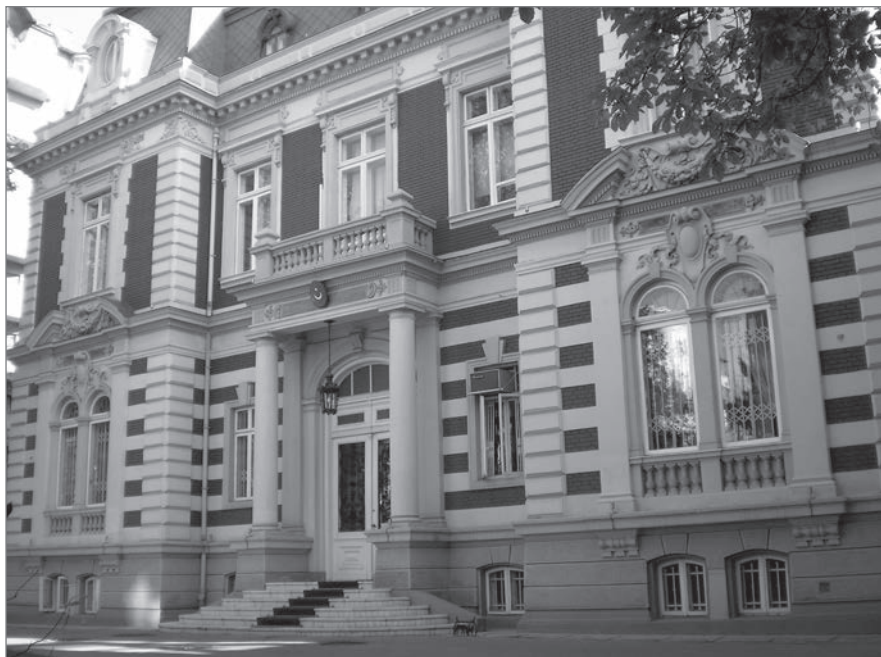
Фото 8. Приміщення у центрі м. Бухареста, вул. Каля Доробанцілор, 72, де протягом 1918–1922 років була розмішена перша Надзвичайна дипломатична місія Української Народної Республіки в Румунії та де на початковому етапі своєї діяльності функціонував створений у 1922 році Український комітет з питань надання допомоги емігрантам у Румунії ім. С. Петлюри. Нині будівля належить посольству Туреччини в Румунії