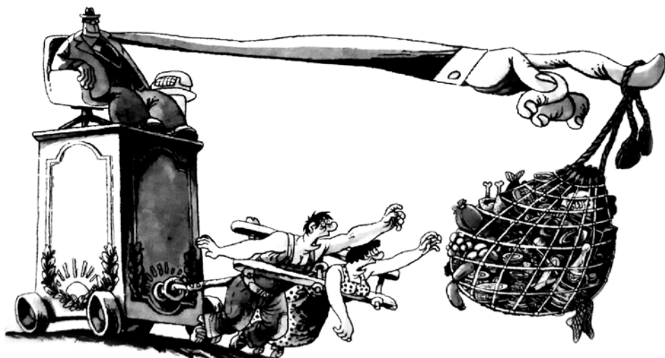
Іл. 7 90