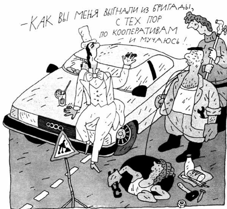
Рисунок В. ДМИТРИЮКА.