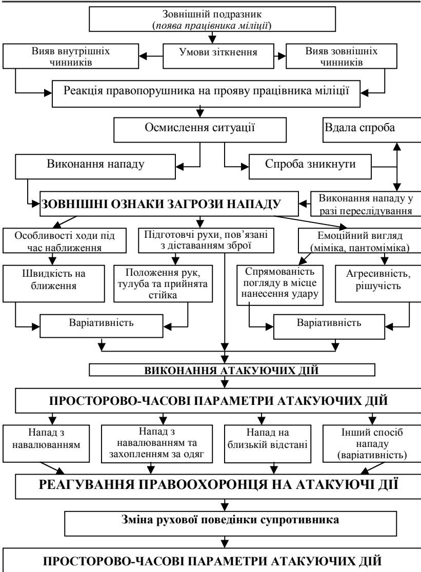
Рис 1. Ситуаційна модель рухової та мотиваційної поведінки супротивника в умовах несподіваного зіткнення із працівником міліції