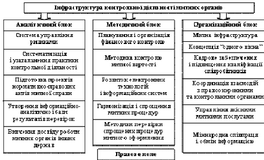
Рис. 2. Модель інфраструктурного забезпечення державного фінансового контролю в системі митних органів

Інфраструктурне забезпечення державного фінансового контролю в системі митних органів може бути подано як комплекс взаємопов'язаних елементів, що обслуговують контрольні процеси. Комплекс інфраструктурного забезпечення державного фінансового контролю структурується у вигляді цільових блоків – аналітичного, методичного та організаційного, його модель зображено на рис. 2.