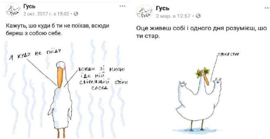
Рис. 1. Мем «Гусь», автор Н. Кушнір

Окремої уваги також заслуговує інший публік в соціальних мережах Facebook, Вконтакті та Instagram «Файні мему про українську літературу» (Рис. 2), де рядки з творів Т. Шевченка, І. Франка, М. Коцюбинського, М. Хвильового та інших перетворилися на дотепні коментарі до різних сучасних ситуацій і подій або заново інтерпретувалися. Метою публіки є спроба пробудити інтерес української Інтернет-аудиторії, особливо школярів, до рідної літератури, при цьому як інструмент використовуючи мему, що мають привабливу гумористичну оболонку, а по суті виконують навчально-виховну місію. Оскільки знання мемів є важливою умовою для здійснення безперешкодної комунікації в кіберпросторі культури, користувач, який не зрозумів контент мему, для того, щоб залишатися в тренді, скоріше за все звернеться до оригіналу твору або до пошукових систем Інтернету, щоб все ж таки досягнути, чому «журиться» Тарас або навіть йому шукати долю, і таким чином мем починає працювати на мету публіки.