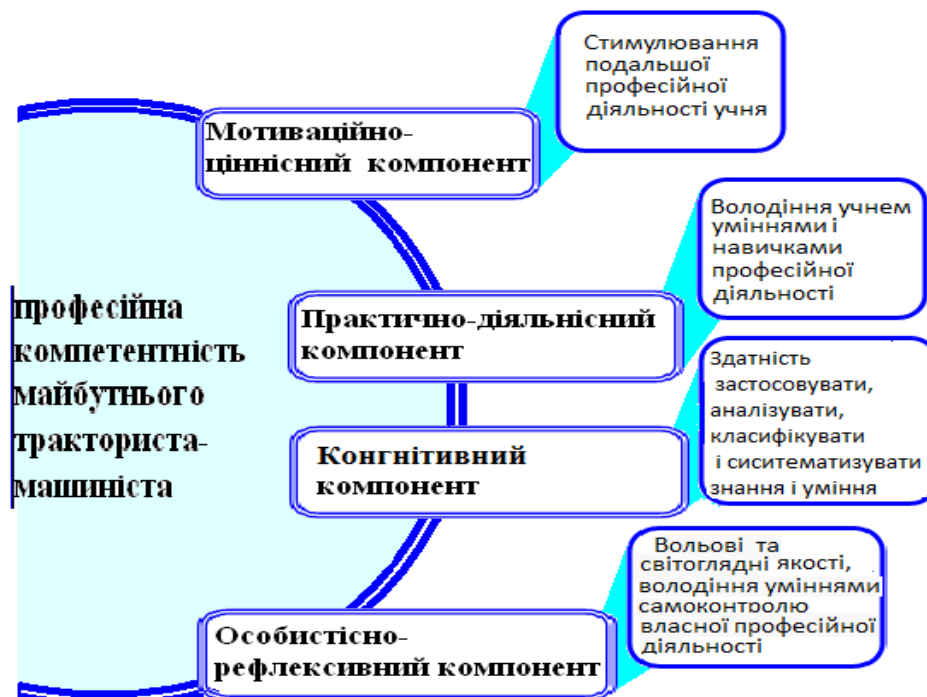
Рис. 2. Структурні компоненти професійної компетентності майбутнього тракториста-машиніста

Ця структурна модель, як і інші, лише відносно відображає всі характеристики структурних складових професійної компетентності майбутнього тракториста-машиніста. Більш ґрунтовно зміст професійної компетентності розкривають її функції: