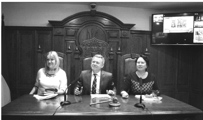
Між Вищим господарським судом України та господарськими судами Рівненського апеляційного округу в режимі відеоконференцв'язку обговорено нагальні питання застосування лізингового законодавства

11 грудня 2014 року між Вищим господарським судом України, Рівненським апеляційним господарським судом, Господарським судом Рівненської області, Господарським судом Волинської області, Господарським судом Вінницької області, Господарським судом Житомирської області та Господарським судом Хмельницької області проведено сеанс відеоконференцв'язку з обговорення проблемних питань застосування лізингового законодавства під час розгляду господарських спорів.