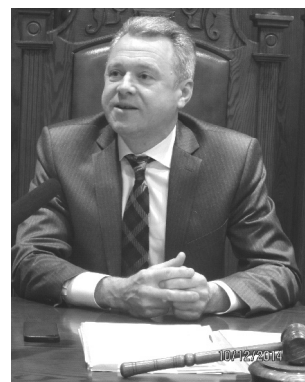
Г. Кравчук: «Через лізинг у Європі фінансується 25–30% усіх інвестицій»

Г. Кравчук зазначив, що, зважаючи на великий ступінь зносу основних засобів у всіх сферах економічної діяльності в Україні, що становить майже 80%, та відсутність джерел фінансування для їх оновлення, лізинг може стати дієвим механізмом розвитку та