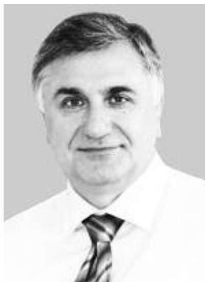
Віктор ОГНЕВ'ЮК, ректор Київського університету імені Бориса Грінченка, член-кореспондент НАПН України, доктор філософських наук, професор

Сучасний університет як співтовариство студентів і професорів, об'єднаних спільними цінностями, науково-освітніми і духовно-культурними інтересами, – і в Європі, і в Україні, – пройшов шлях тривалого еволюційного розвитку та революційних трансформацій, що характерні не лише для останніх десятиліть, а й більш як тисячолітнього періоду його історії.