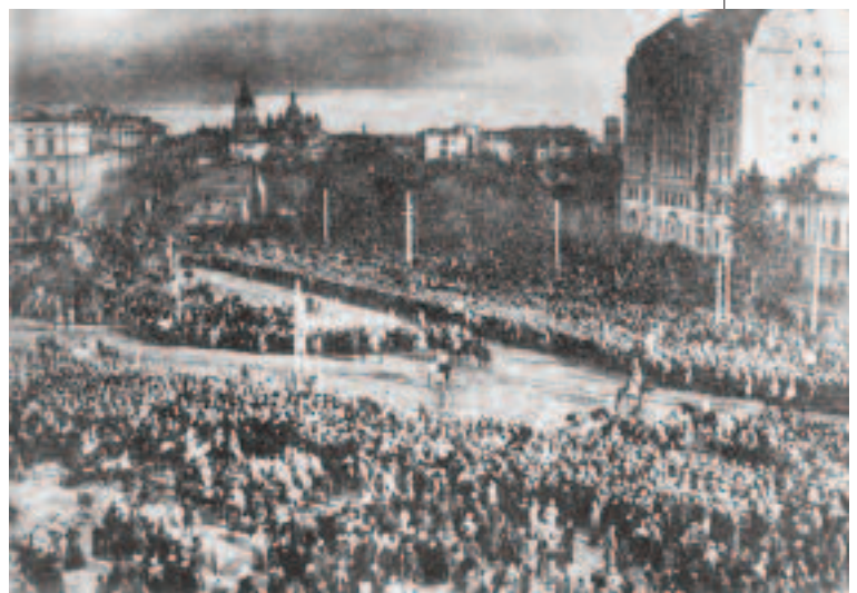
Проголошення Акта злуки українських земель на Софійській площі в Києві. 22 січня 1919 року. Знято з дзвіниці Софійського собору. На обрії видно ще не зруйнований Михайлівський Золотоверхий собор

Соборність — явище багатоманітне. І навряд чи буде правильним обмежувати його лише ідейно-духовним чи територіальним виміром. Не секрет, що суспільна єдність забезпечується не в останню чергу потужними економічними складовими, високими життєвими стандартами громадян. Соціальна поляризація підриває кон-