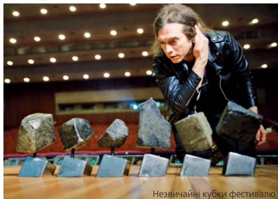
Незвичайні кубки фестивалю