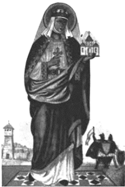
Рис. 3. Рівноапостольна княгиня Ольга

приміром: об'єднувач Норвегії Харальд Харфарг — "Кошлатий" ("Патлатий"); старший син Ерик — "Кривава сокира" (за жорстокість до родичів); молодший Гакон — "Добрий"; "Сіра шкіра" за жадобу; "Свейн Віслобородий", "Гарольд Синезубий" за зовнішні особливості; хрестителя Норвегії за життя називали "Дігре" — "Товстун" (рис. 4). Його, до речі, визнано "святим" обома церквами: Східною і Західно-християнською.