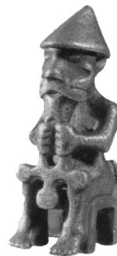
Рис. 5. Тор захищає встановлений світопорядок, бореться проти сил Хаосу. Молот уособлює закони та примножує силу

Для найближчого оточення володарки, війська з Північної Європи, ці події також свідчили про те, що господарка вічної темряви знову отримала коштовний дарунок. Бог вогню Локі, найменший 12-й син головного бога Одіна, закликав старшого брата Тора постійно змагатися з велетнями, що уособлювали безлад. Тільки охоронець доброду може пересилити небогу Хель, вибороти, звільнити душу Інгвара (рис. 5).