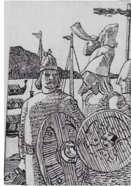
Рис. 4. Олаф Харальдсон

Яку повагу і пошану треба було заслужити княгині, щоб найближче оточення, чужоземне військо визнало її за життя "святою" — "Хельга"! За володарювання свого чоловіка, упродовж чотирьох десятиліть, Ольга сприяла християнізації Русі, популяризуючи та впроваджуючи "світле вчення". "Богослужбний рай церковний сотворила", — зазначав "другий Златоуст" Кирило Туровський, поширювач християнського вчення [7, с. 115; 8, с. 215].