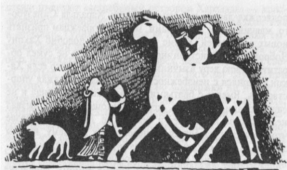
Рис. 6. Герой приходить у Вальгаллу. Фрагмент зображення із готландського каменя

неного Тором. А Один особисто мав провести почесного військового героя у власні чертоги (рис. 6). Так, згідно зі скандинавськими уявленнями, мав відбуватися зв'язок земних та небесних сил і подій.