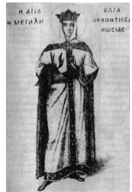
Рис. 2. Княгиня Ольга Багрянородний

Згадку про княгиню зафіксовано під час її візиту до столиці Константинополя у другій половині 946 року [1, с. 195, 205—206; 2, с. 118, 303].