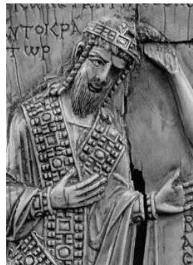
Рис. 1. Костянтин VII Багрянородний

Рос", "Ігемон і Архонтиса Рос Єльга" — так випадково увічнів, засвідчив очільник потужної імперії найвище прижиттєве, почесне звання. Насправді, рівнозначний переклад — "Свята Руси", "Свята очільниця Руси", "крокуюча попереду Руси Свята" (рис. 2).