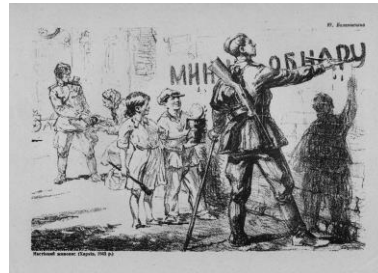
Фото 25. Настінний живопис (Харків, 1943 р.), худож. Ю. Баланівський