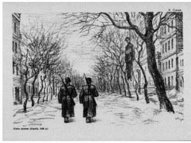
Фото 22. Кінна вулиця (Харків, 1942 р.), худож. П. Супонін