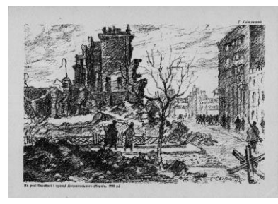
Фото 23. На розі Басейної і вулиці Дзержинського (Харків, 1943 р.), худож. Є. Світличний