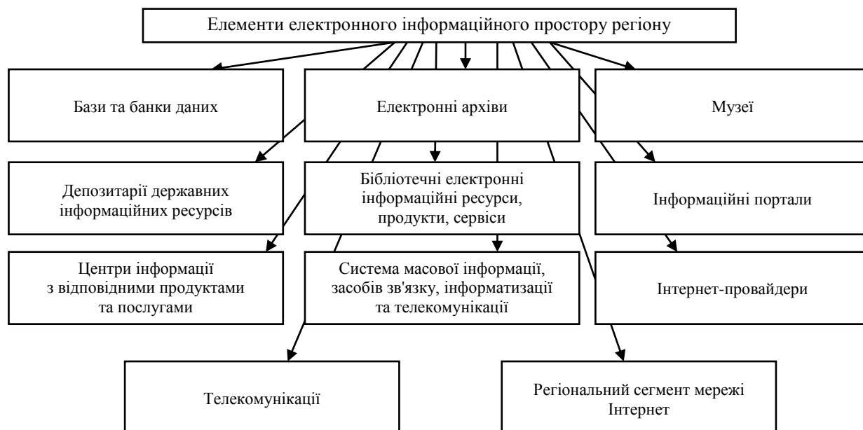
Схема 1. Елементи інформаційного простору регіону

Виклад основного матеріалу дослідження. Електронний інформаційний простір регіону — це насамперед система взаємин між виробниками, розповсюджувачами, зберігачами та користувачами інформації, тобто між усіма учасниками нинішньої системи інформаційних комунікацій, елементи якої наведено в схемі 1.