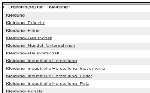
Фото 7. Аспекти розгляду слова "Одяг"

Тематичний пошук за каталогами можна порівняти з пошуком за ключовим словом в електронному каталозі. Спробуємо знайти документи, що стосуються виробництва одягу (фото 8).