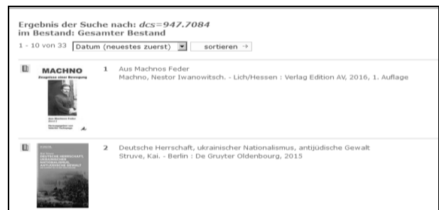
Фото 6. Перелік бібліографічних записів документів

Варто зауважити, що для застосування в тематичному пошуку будь-якої класифікації слід мати певні навички користування бібліотечною ієрархією, орієнтуватися в її структурі чи точно знати необхідний індекс. До речі, якщо індекс потрібної рубрики достеменно відомий, ним можна скористатися як пошуковим елементом. Наприклад, використаємо індекс 947.7084 (" Історія України 1917—1953 років ") у простому пошуку й одразу перейдемо до переліку бібліографічних записів документів (фото 6).