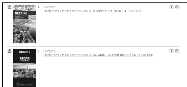
Фото 9. Перелік бібліографічних записів документів (карти України)

Іноді, за умови нескладного запиту, достатньо використати ключове слово та обрати вид документа (наприклад, "Україна — карти"), відсортувати надходження (наприклад, першими розташовані новіші видання) та отримати необхідний перелік записів (фото 9).