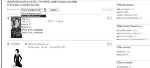
Фото 3. Перелік бібліографічних записів документів, зібраних під рубрикою каталогу 746.92092 Дизайнер моди

Для обмеження й уточнення пошуку доцільно також скористатися переліком категорій документів "Усі види матеріалів" ( Alle Materialarten ), переліком каталогів і зібрань ( Alle Kataloge/Sammlungen ) чи списком бібліотек ( Alle Standorte ). У всіх категоріях зазначено кількість наявних документів (фото 4).