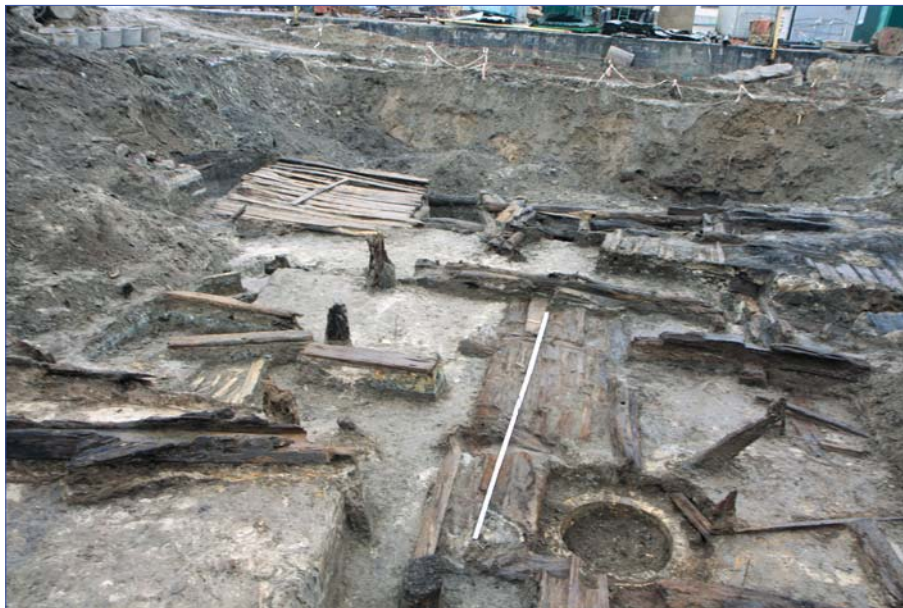
Рис. 3. Рештки виявлених гідротехнічних та шляхових споруд XVII–XVIII ст. 2015 р.