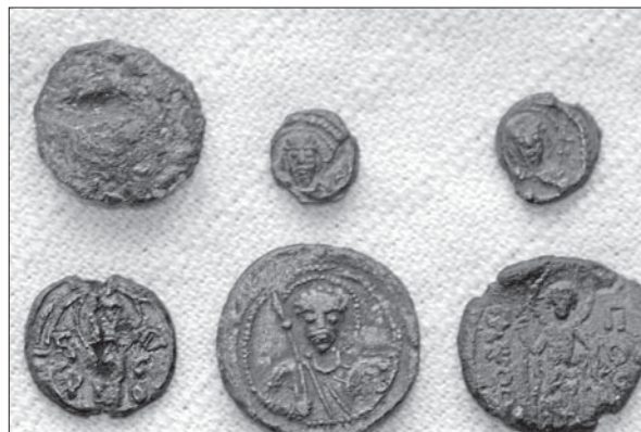
Рис. 7. Акткові княжі печатки XI–XII ст. Свинець. 2016 р.

— Це може бути пов'язане з періодом потепління у середньовіччі?