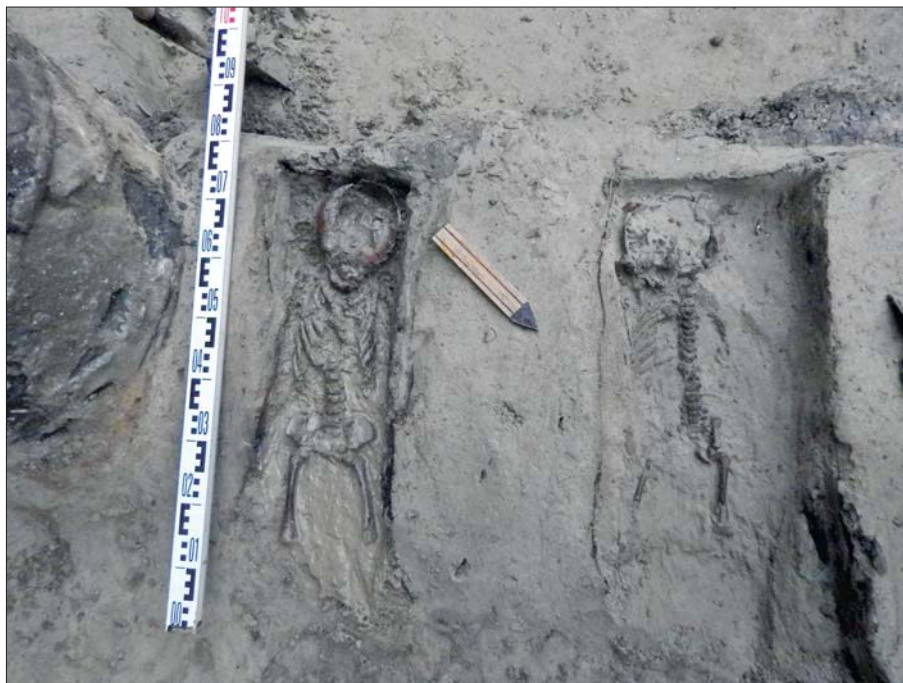
Рис. 8. Дитячі поховання, що датуються XII–XIII ст. 2016 р.

лише традиційних для цієї місцевості товарів, які князі зазвичай збирали у вигляді данини, — мед, хутро, ремісничі вироби тощо. Ці товари позначалися особливими товарними бирками, ми їх добре знаємо і знаходимо досить часто. Проте були й інші види товарів. Де і як оформляли на них документацію, як їх маркували, ми достеменно не знаємо, але ж вони повинні були оформлятися і маркуватися.