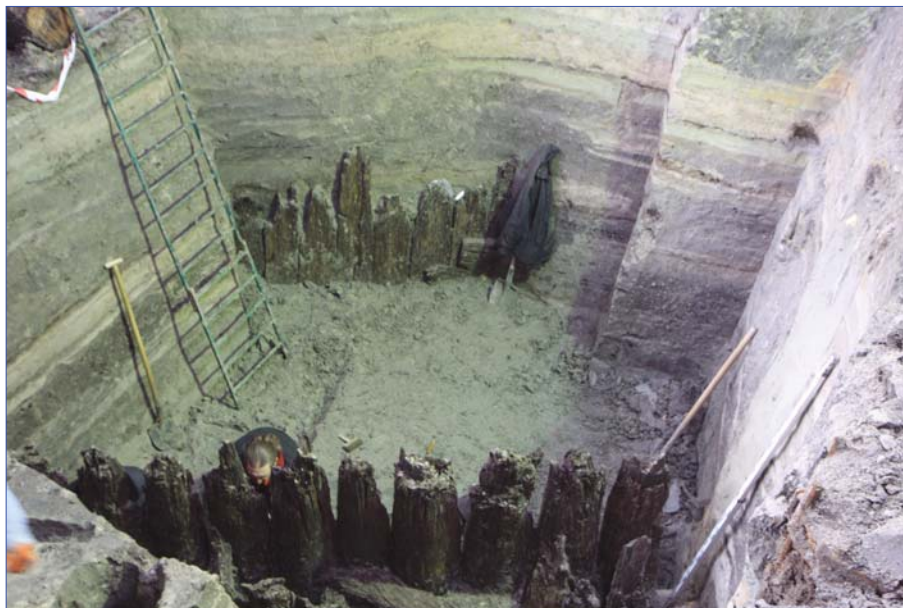
Рис. 4. Вулиця XII ст. з дерев'яними парканами. 2015 р.

рі, тобто побудовані ще в польсько-литовський період захисні вали, облаштовували системами новітньої на той час фортифікації для гарматного бою. Тому ми й орієнтувалися на те, що