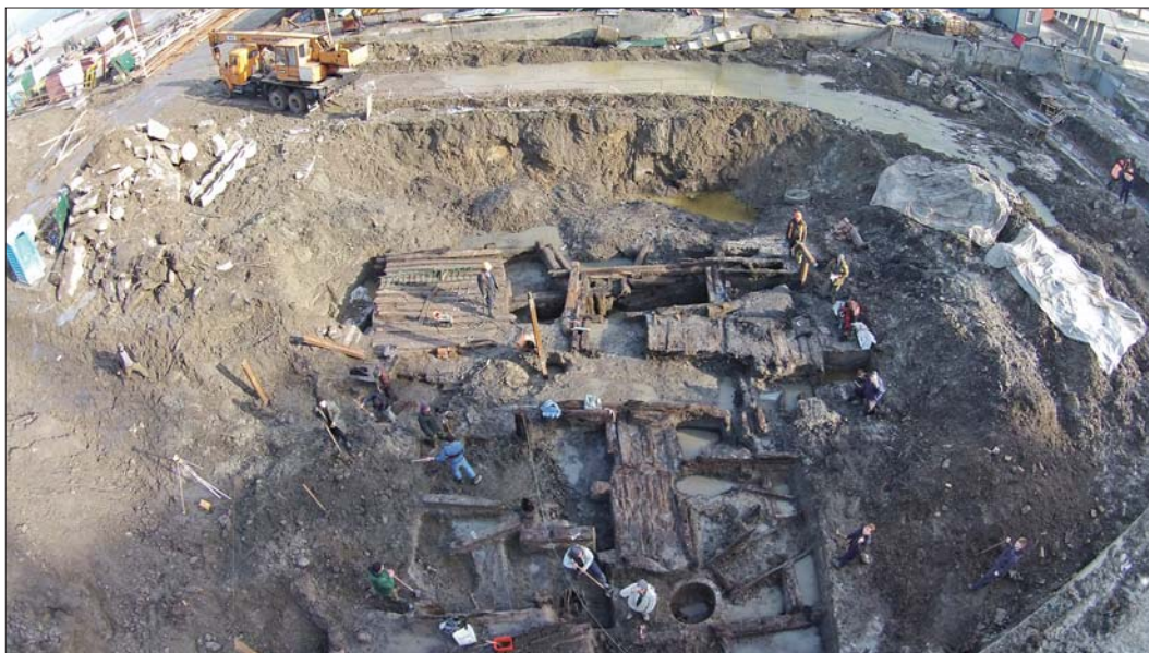
Рис. 1. Загальний вигляд розкопу на Поштовій площі з пташиного польоту. Зима 2015 р.

підтверджено. А письмові джерела того часу не надійні, рясніють різночитаннями через різні компіляції та редакції документів, що значною мірою розмиває хронологію. У відомій «Повісті минулих літ» є слова, які належать до 945 року і на яких тривалий час акцентували увагу дослідники: «...на Подоліи не седяху людие, но на горе...». Проте що саме хотів сказати літописець, невідомо. Як можна оцінити це повідомлення? Чи йдеться про те, що люди тут не селилися, чи літописець звернув на це увагу лише тому, що паводок або якесь інше природне явище, пов'язане з великою водністю, змусило їх рятуватися на горі?