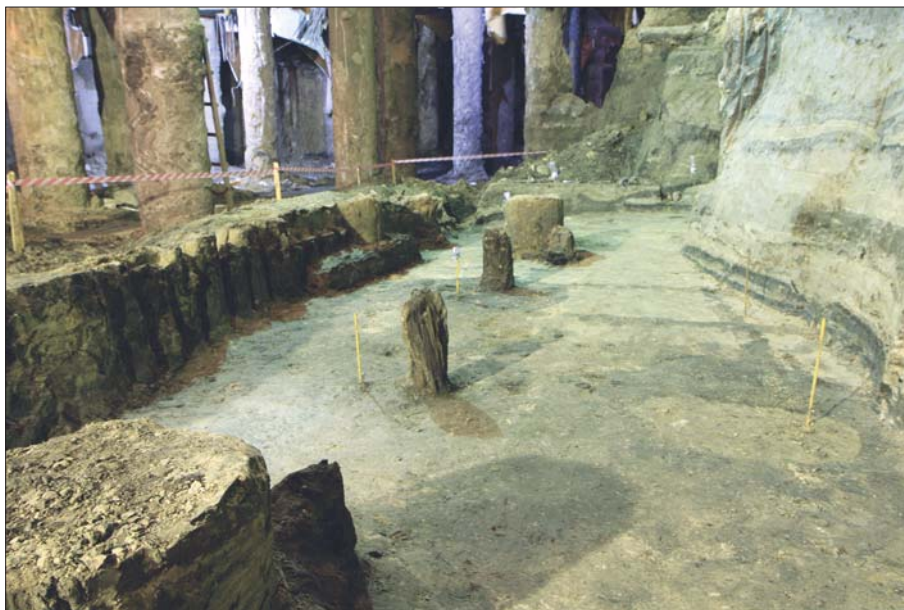
Рис. 6. Вигляд дерев'яного паркану з боку садиби XI–XII ст. 2016 р.