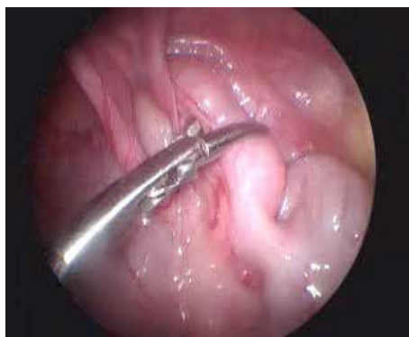
Рис. 3. Дислокація апендиксу з пахвинного каналу за допомогою грасперу.