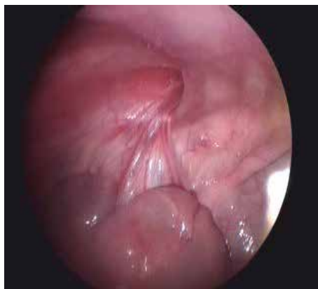
Рис. 1. Розширене внутрішнє пахвинне кільце зліва.

Оскільки апендикс візуально був не зміненим, апендектомія не проводилася, апендикс був розміщений у ретроцекальному положенні. Після цього проведено герніорафію за методом PIRS – percutaneous internal ring