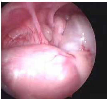
Рис. 2. Апендикс у просвіті правого пахвинного каналу.