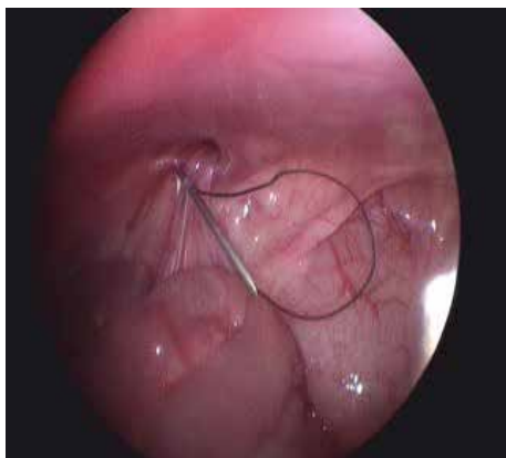
Рис. 4. Пункційне інтраабдомінальне формування петлі.

Через 1-шу добу після проведення операційного втручання хворий у задовільному стані виписаний додому. Контрольний огляд через 10 днів – рани загоєні первинним натягом, пахвинні кільця не розширені, ознак патології органів черевної порожнини немає. Рекомендовано