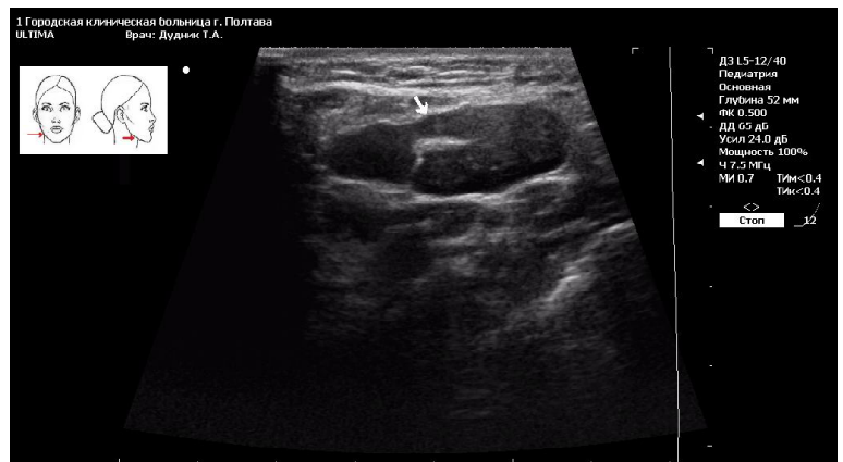
Рис. 1. Ультразвукове зображення структури піднижньощелепного лімфатичного вузла хворого М., 9 років (Історія хвороби № 4601). D. S. Гострий гнійний піднижньощелепний одонтогенний лімфаденіт. Визначається одне гіпоехогенне порожнисте утворення з чіткими контурами, розміром 3.0 X 1.5 см. Прилеглі тканини ущільнені.

Слід зауважити, що ступінь ехогенності може носи-