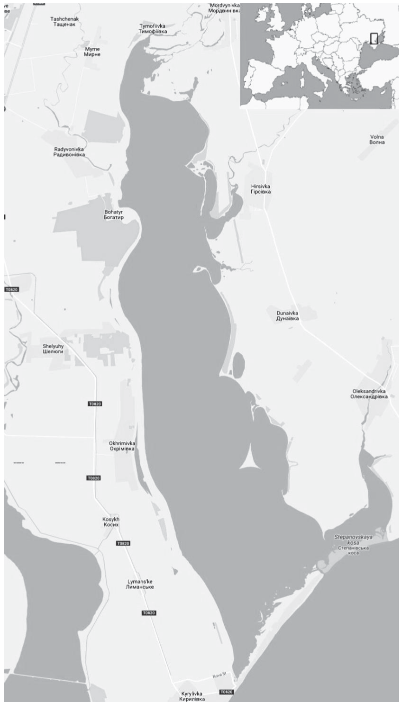
Рис. 1. Картосхема Молочного лиману