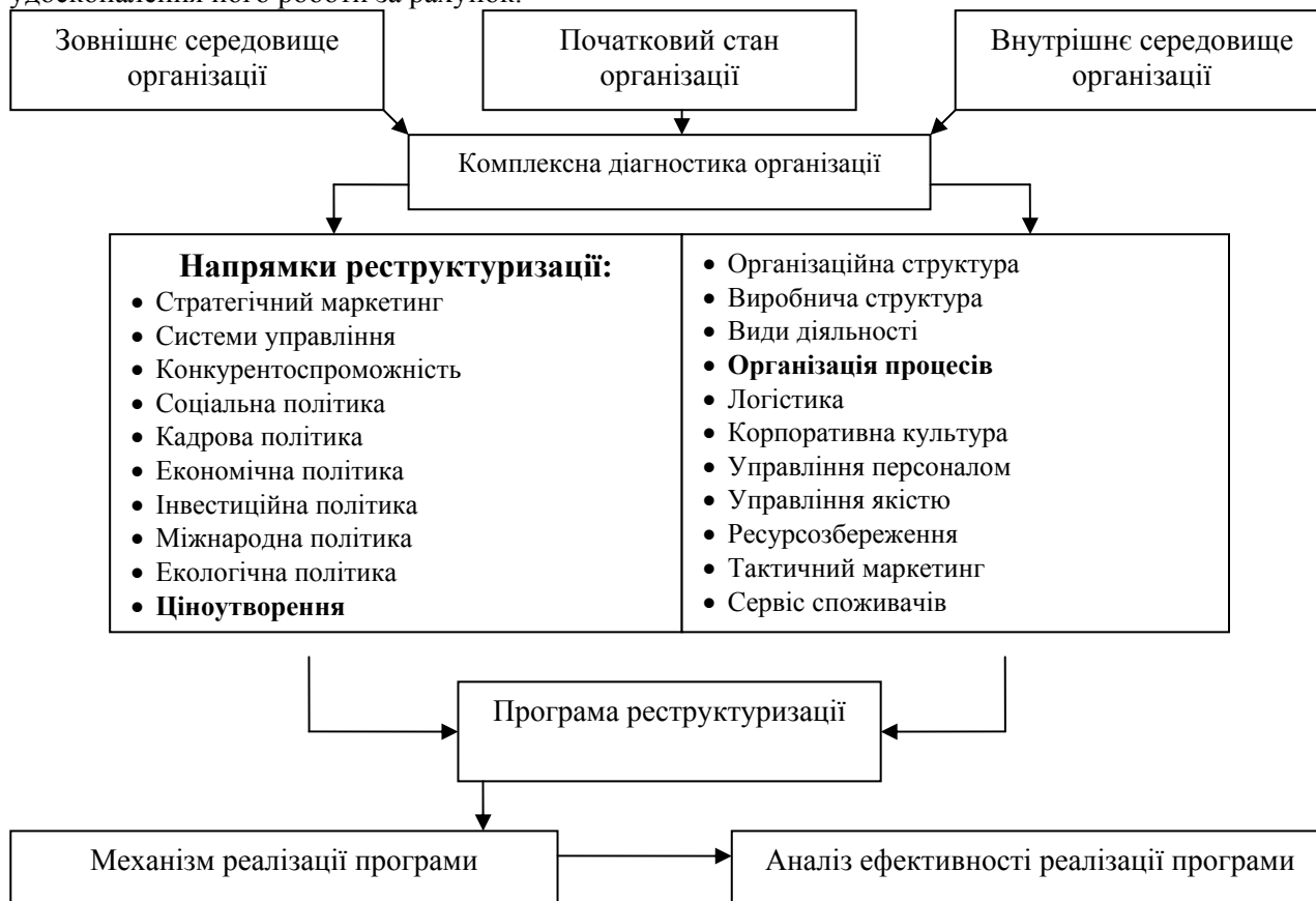
Рис. 1. Принципова схема реструктуризації підприємства

Вирішення задач такого класу Фатхутдінов пропонує виконувати за допомогою системного підходу [3]. Системний підхід – це методологія дослідження об’єктів як системи. Система утворюється з двох складових: первинно-зовнішнього оточення, яке включає вхід і вихід системи, зв’язок із зовнішнім середовищем, зворотний зв’язок, та вторинно-внутрішню структуру – сукупність взаємопов’язаних компонентів, які забезпечують процес взаємодії суб’єкта і об’єкта, переробку входу у вихід і досягнення цілей системи.