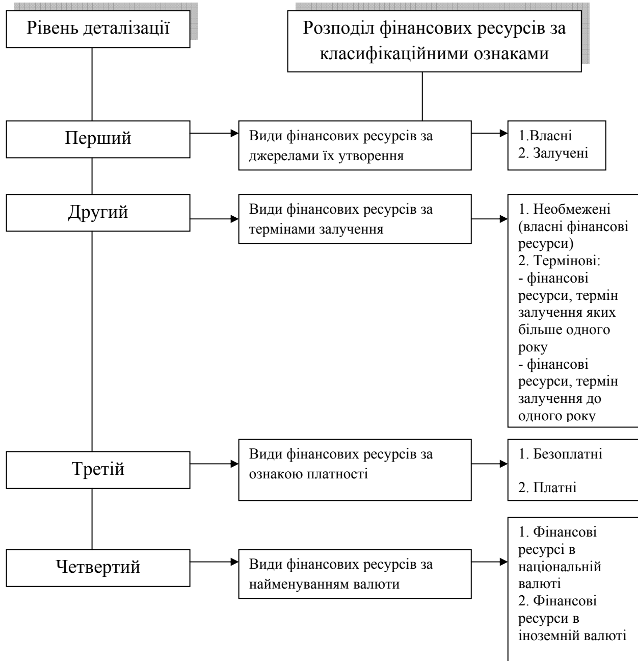
Рисунок 1 – Класифікація фінансових ресурсів підприємства

Класифікація фінансових ресурсів підприємства зображена на рис. 1.