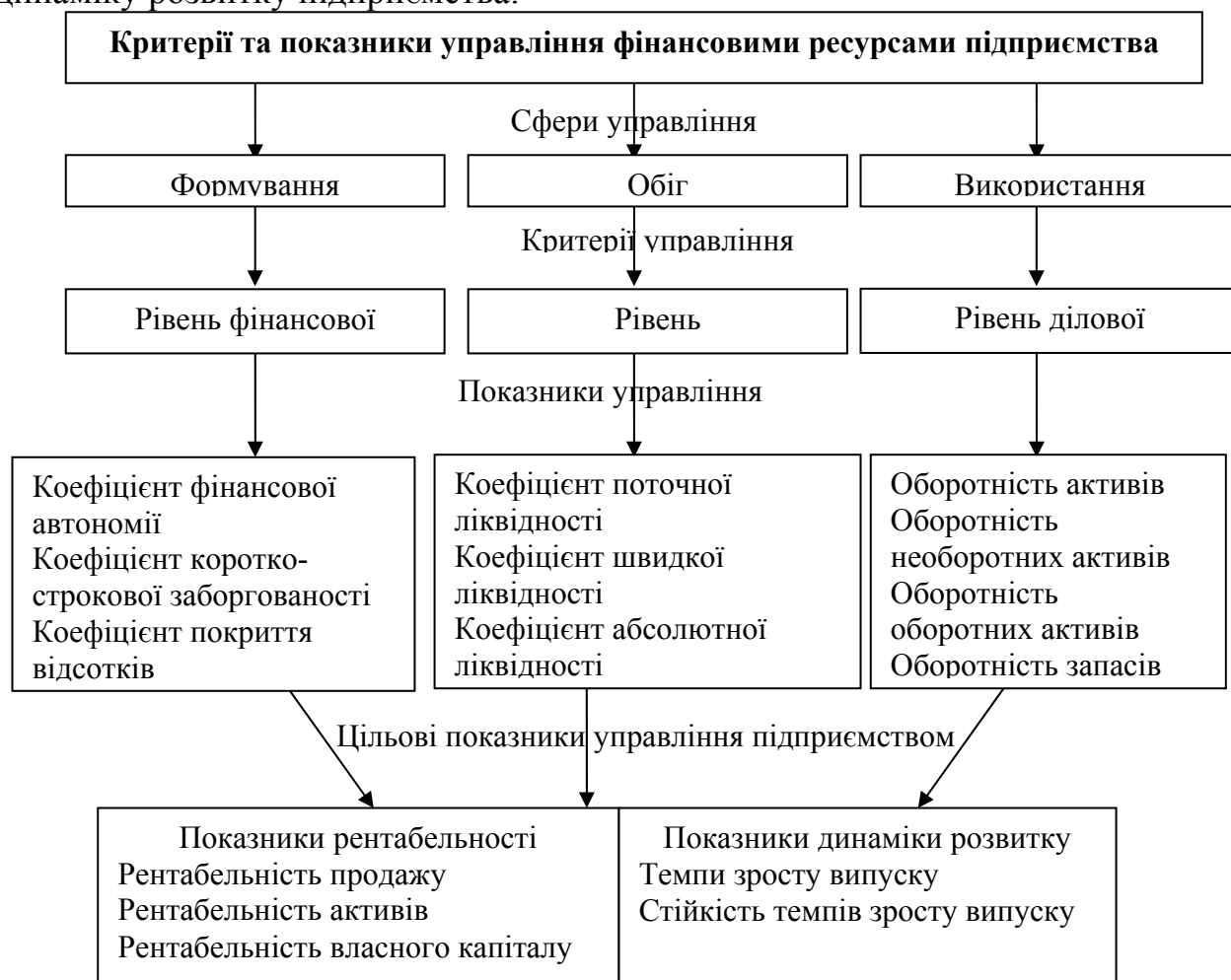
Рисунок 3 – Критерії та показники управління фінансовими ресурсами підприємства

Оцінку якості управління фінансовими ресурсами підприємства необхідно проводити за критеріями стійкості, платоспроможності та ділової активності, які розглядаються через показники структури капіталу, ліквідності та оборотності, що дає можливість кількісно оцінити вплив якості управління фінансовими ресурсами на рівень рентабельності та динаміку розвитку підприємства.