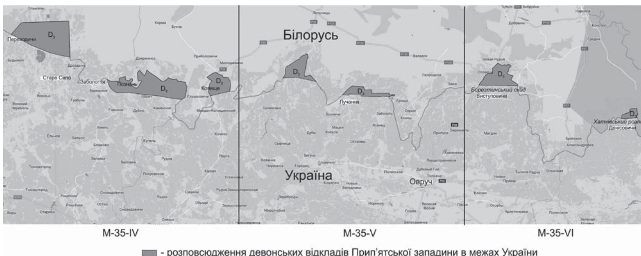
Рис. 1. Оглядова карта розповсюдження девонських відкладів крайової частини Прип'ятського прогину з границями листів Державної геологічної зйомки масштабу 1:50000.