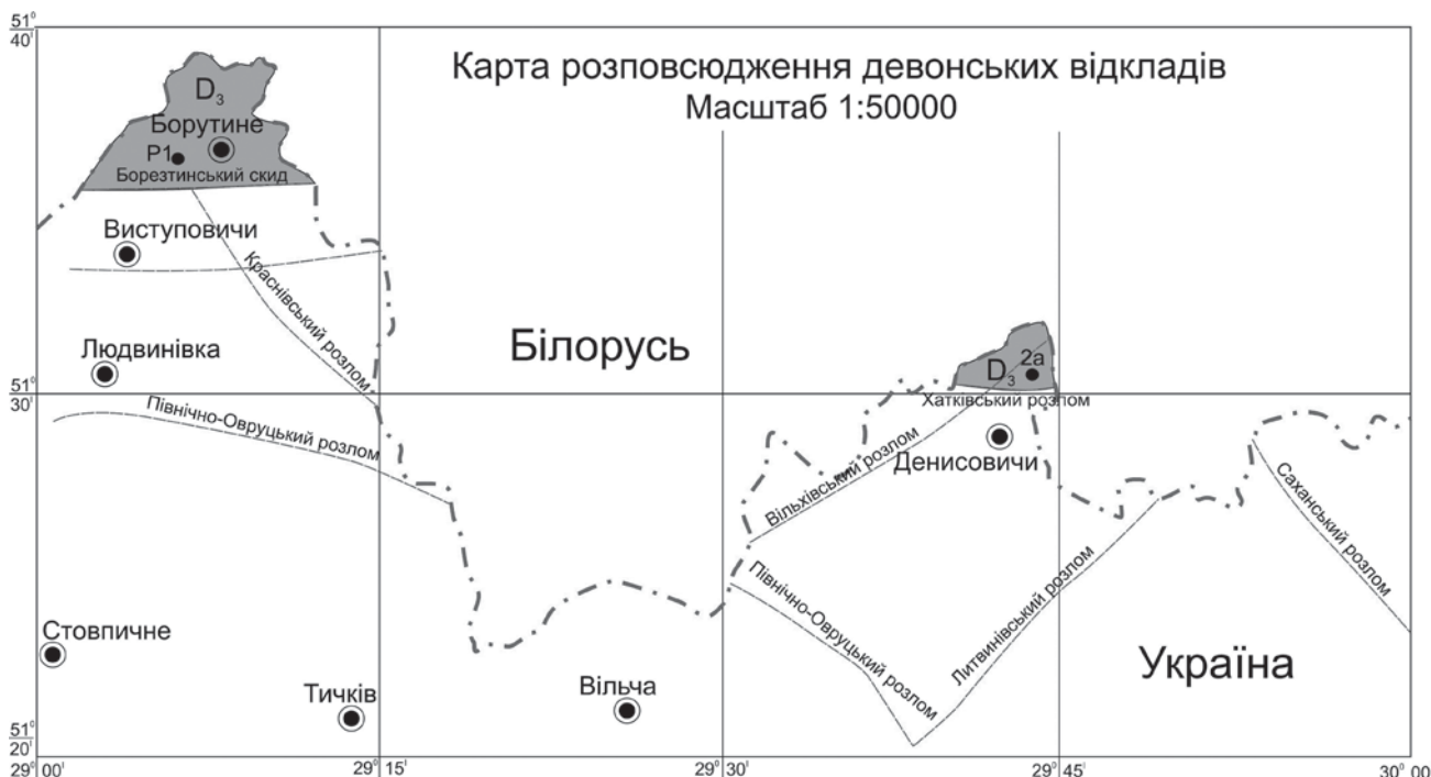
Рис. 4. Карта розповсюдження девонських утворень в межах аркушу М-35-VI (Горіна, 2016).